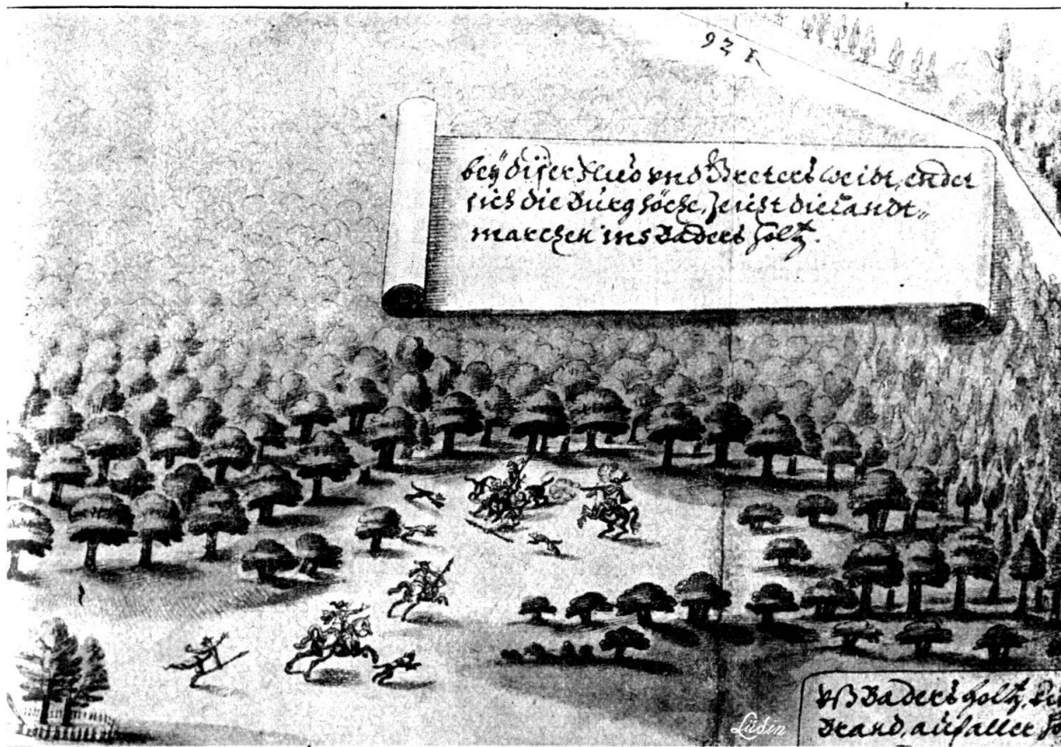
Textabbildung 2: Ausschnitt aus dem Plan: Grenzlinie oberhalb Lostorf.

1615 ausgeführt, der Regierung von Basel übergeben hat, und der jetzt im historischen Museum sich befindet. Die getreue Wiedergabe zahlreicher Einzelheiten, die mit der Zeit verschwunden sind, machen ihn zu einer unvergleichlichen Urkunde für das Stadtbild des 17. Jahrhunderts. Bei genauerer Betrachtung wird man erkennen, daß er nicht nur ein künstlerisches Werk ist, sondern daß ihm auch eine