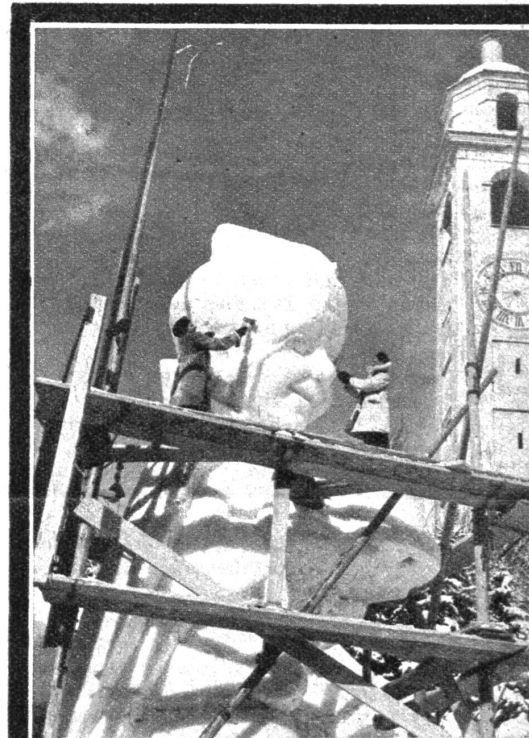
In St. Moritz geht die grösste Eisplastik der Welt, die man auf «Ali Java» getauft hat, ihrer Vollendung entgegen. Sie ist 12 Meter hoch. Für die Herstellung benötigten die Schöpfer der Monumentalplastik 400 m 3 Schnee!