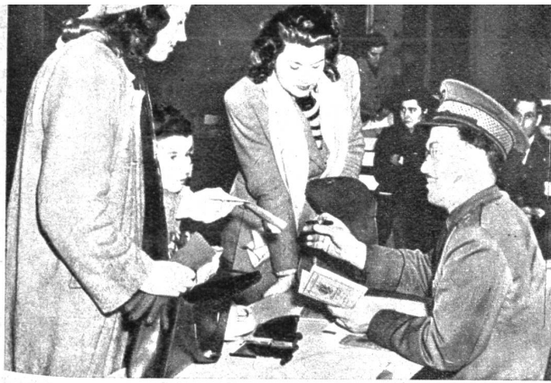
Drei Französinen sind zu spät gekommen

Die USA. hatten während geraumer Zeit bis zum 31. Dezember den Bräuten und Frauen von amerikanischen Soldaten, die in Europa zurückgeblieben waren, die Einreise erleichtert. Nun sind am 2. Januar 1948 noch drei Französinen auf dem Aerodrom von Wilmington gelandet, die glaubten, auf Grund dieses Gesetzes einreisen zu können. Höflich aber bestimmt wurden sie auf die bestehenden Vorschriften aufmerksam gemacht und müssen nun die Konsequenzen ihrer verspäteten Ankunft tragen. (NYT.)