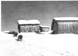
Unterwegs von Safien-Thalkirch nach Safien-Platz

Im Winter ist es im Safiental, einem roten Nebental des Sorderrheinlandes, beglückend still und darum eine Reizenberuhigung abgesehen für überlebe Gläubler. Hier weiß man nichts von Politik, Krieg, Zeitfragen, treiben zwischen dem Bärenhorn im Zeltgebund Safiens und dem gebirgten Ort an der Grenze und dem bis tief in eine ununterbrochene Folge von Hahnetabäusen Dörflein, und das für Hängel leicht mobilisiert und leicht mit Stübchen abgehoben für hundertfache Schwungbewegungen schiffen. Hier weiß best' die Stühreihen bleiben fern, denn nicht einmal ein Postauto fährt im Winter. Nur ein atmohäufiger Schlitten führt die wenigen Gäste von Versam ins Tal hinauf. Im frühlichen Spätnachmittag, wenn die blauenhügeligen Zäl empur, liegen plötzlich im Sonnenlicht und Haunen, wie bernese entladet. Doch von dem ledigenbewingenen Ort wird es ein Zielbild ins Sagen und ein Gerüst nach allen Seiten, das es uns hier von der tiefschönen Fahrt in einem der Galtwege tritt z. S. ins jahrbunterteit Spätnach (das Haus der Zuro-Zuro), nimmt uns bergwärts Galtlöcher in Empfang, die uns das Wörtlein „Galt“ neu erleben läßt.