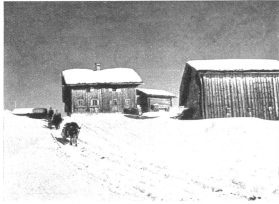
Unterwegs von Safien-Thalkirch nach Safien-Platz