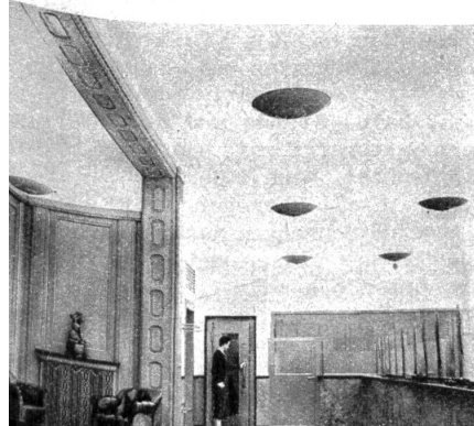
Partie aus dem Schalterraum