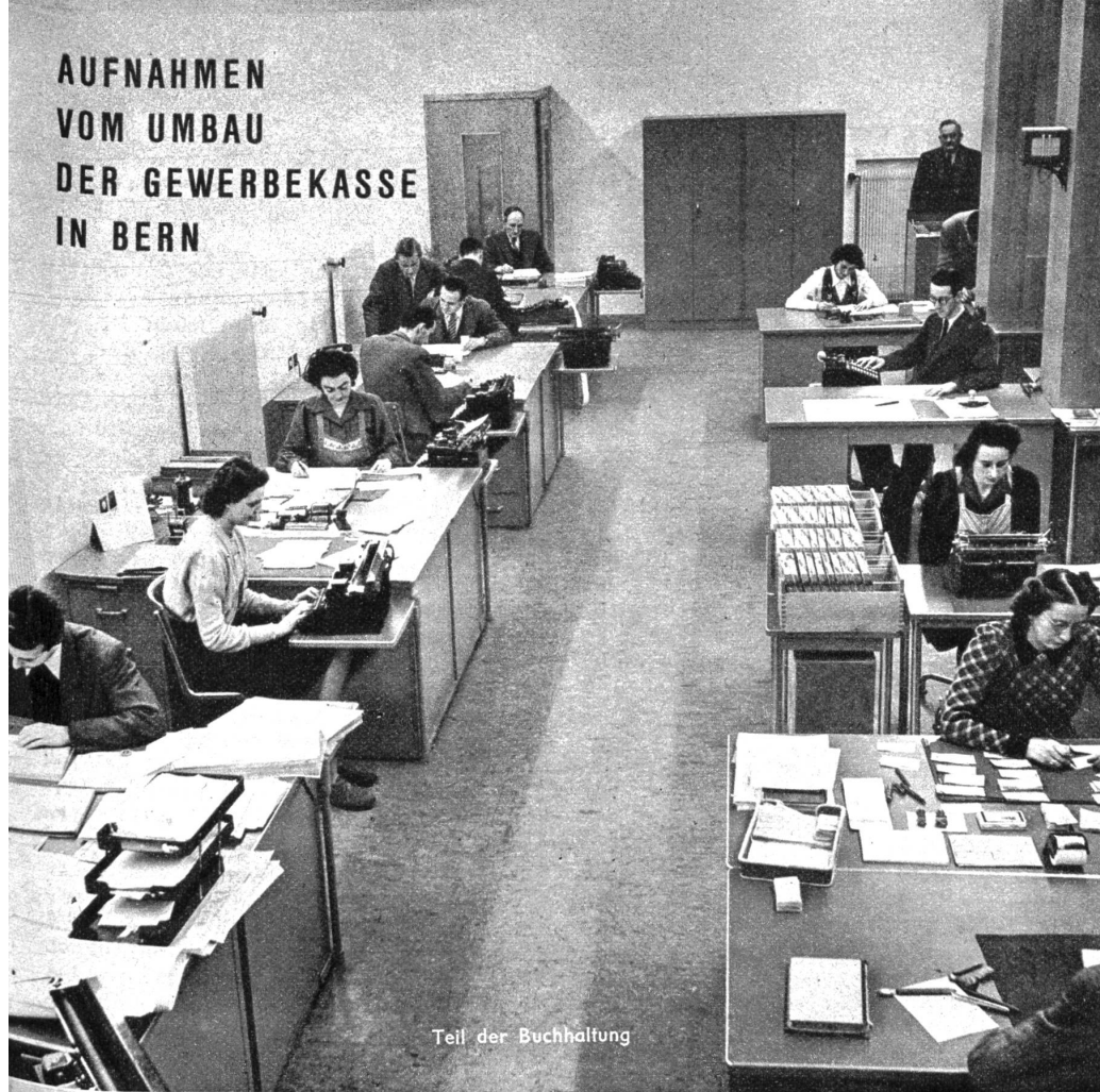
Teil der Buchhaltung

dem sich die Kunden im ersten Stock oft aufhalten müssen, ist gepflegt und wohnlich gehalten. Die schönen Werke vom Maler A. Neuenschwander heben diese Wirkung noch hervor. Sowohl die Büros im ersten als auch im zweiten Stock sind trotz ihrer geschäftsmässigen Anordnung nett, freundlich und voll Licht. Die Verbindungstreppe vom zweiten Stock in den Schalterraum ist an und für sich ein kleines Meisterstück der Innenarchitektur und der Saferaum mit dem kleinen Vorzimmer tritt durch seine Gestaltung und Form neu in den Vordergrund des Interesses.