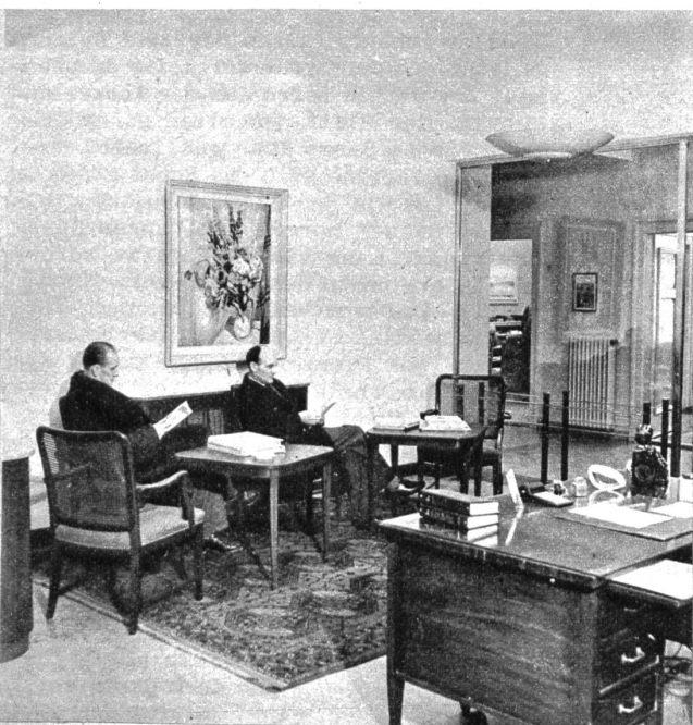
Die wohnlich eingerichtete Ecke für Kunden