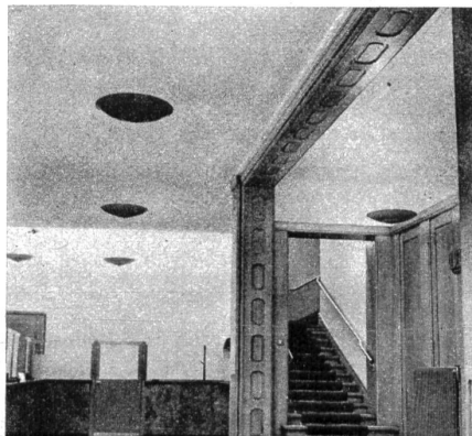
Die schöne Treppenverbindung vom ersten in den zweiten Stock