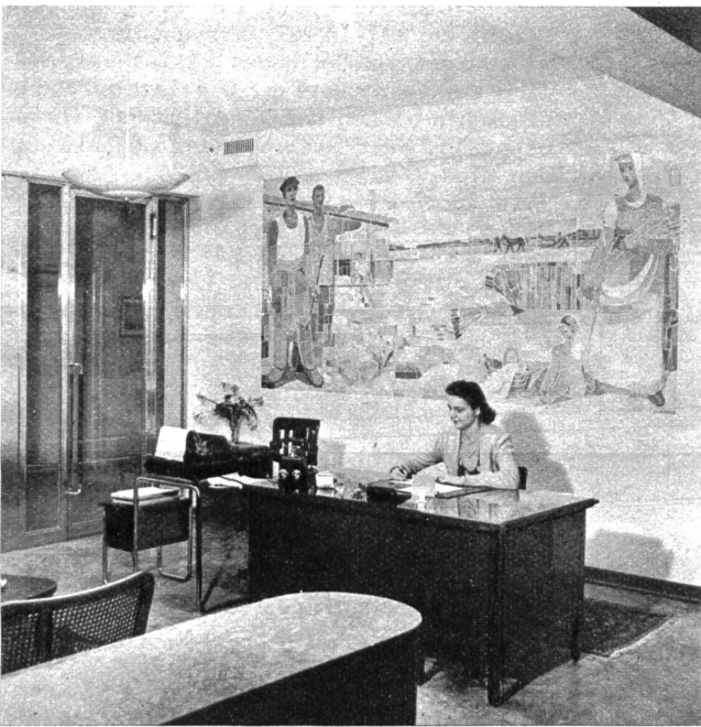
Das Foyer mit dem grossen Wandbild von A. Neuschwander

In diesem Hin und Her musste eine durchgreifende Regelung gefunden werden, und es scheint, dass durch den Umbau, dessen sorgfältige und gewissenhafte Planung und Ausarbeitung ein volles Jahr in Anspruch genommen hatte, nun den Angestellten und