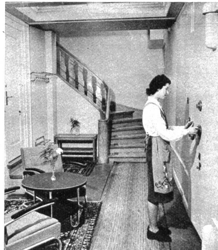
Eingang zum Saferaum