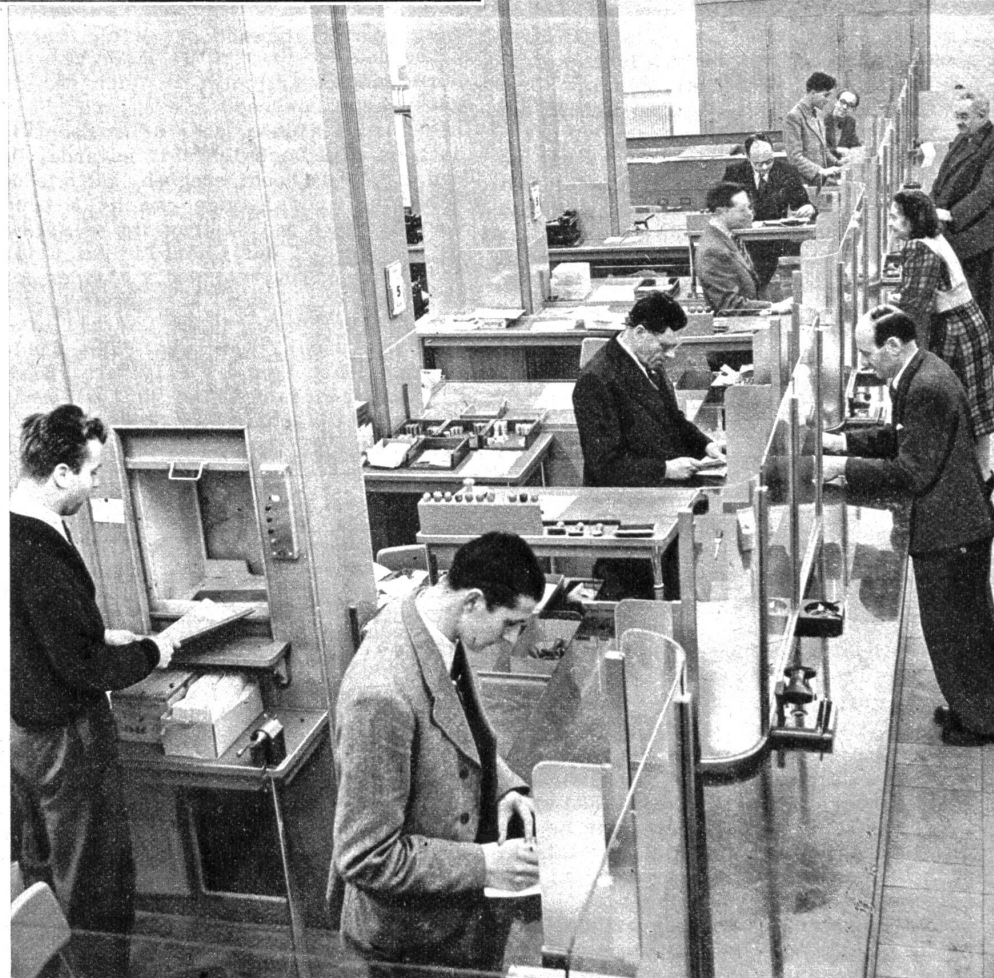
Bedienung der Kunden an den Schaltern