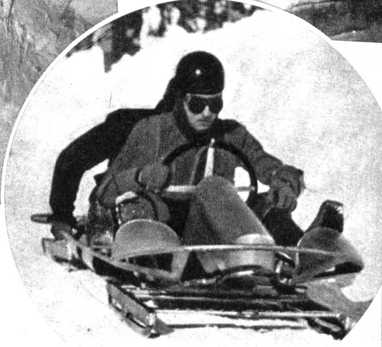
Mitte rechts: Dann begibt man sich an den Start. Der grosse Moment ist gekommen! Sturzhelm und Knieschoner werden angelegt - man kann nie wissen. Oben: Während der Hintermann den Bob in Bewegung bringt, ist der Steuermann sich bereits bewusst, dass es nun ganze Konzentration braucht. Rechts: Ein Bob im vollen Schuss auf der Arosener Bobbahn