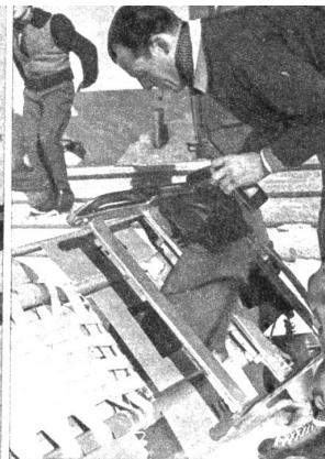
Blauer Himmel und strahlende Sonne, das ist das Wetter zum Bobrennen. Die Bobs stehen bereit, jeder hat seinen besonderen Namen oder ein Wappen