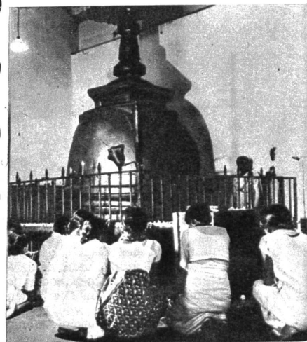
Im sogenannten Untern Tempel stehen verschiedene Dagobas, von denen jede einzelne eine besondere Wirkung ausstrahlen soll

Der heilige Zahn selbst liegt hinter einem soliden Silber-tisch in einem glockenförmigen Behälter - Dagoba geheissen - in dem wiederum sechs über und über mit Smaragden und Rubinen besetzte Kästchen den heiligen Zahn umrahmen, der in der Mitte einer reingoldenen Lotusblume