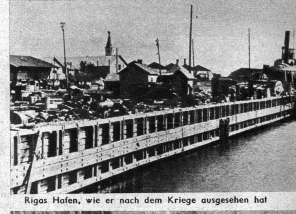
Rigas Hafen, wie er nach dem Kriege ausgesehen hat