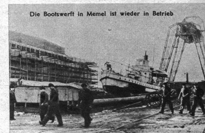
Die Bootswerft in Memel ist wieder in Betrieb