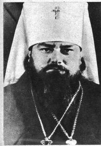
Der Metropolit des Baltikums. Russland erlaubt heute wieder eine bedeutend freiere Ausübung der Gottesdienste als in den Anfangsjahren nach der Revolution, als die Religion als Opium für das Volk bezeichnet worden war.

Von den Stützen der Baltischen Staaten hat Rigas die größte Zukunft und