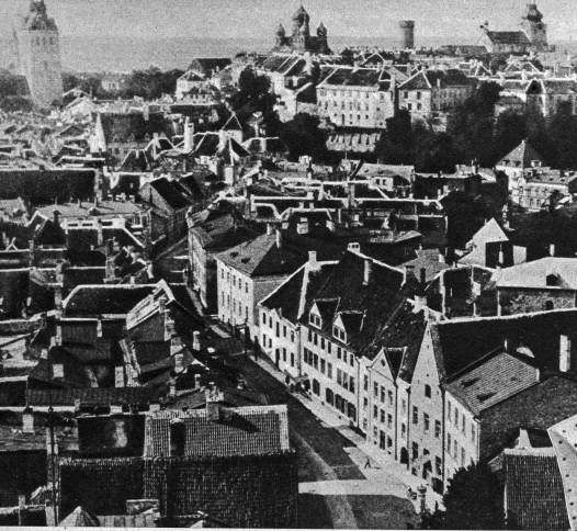
Tallinn mit der russischen Kathedrale im Hintergrund

Staatsminister, Departementsvorsteher, Politiker, Generäle, Regierungssysteme und selbst Staaten mit alter Tradition gehen in der heutigen Zeit nach - um Klanglos unter, die Welt und das Volkswesen beschäftigt sich mit ihnen vielleicht in einigen Leitartikeln, dann auf der zweiten Seite spaltenland und dann wird über den Umweg der neuern Ereignisse wieder zur Tagesordnung übergegangen.