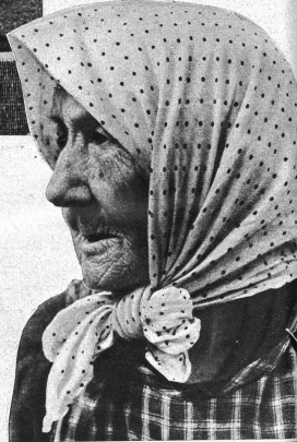
Rechts: Estländerin Unten: Strassenbild aus Libau

ständigkeits verbirgt, die aber unter der russischen Waise mit dem übrigen Russland verschmolzen worden sind. Wohl hat man da und dort in alliierten Kreisen den Walfisch langgelassen, aber das Schicksal der kleinen Randstaaten ist es, von der Welt vergessen zu werden, und in übrigen ist es eine gefährliche Angelegenheit, einem Bären das Abendbrot zwischen den Fingern entreissen zu wollen. So wenig die Deutschen vor der Neutralität dieser drei Staaten Halt machten, so wenig konnte Russland auf seinem Marsch nach dem Westen und der Ostsee entlang dul-