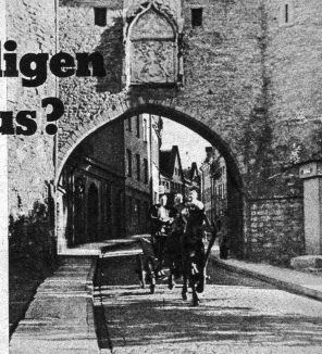
Der deutsche Einfluss der ehemaligen Deutscher ist in den Baltischen Staaten auch heute noch gut sichtbar, und dieses alte Stadttor in seiner reinen Gotik beweis, dass die Geschichte der Länder äusserst wandelbar sind.

Die Lage in diesen Staaten erscheint so weit gefestigt, dass die Verwicklungen politisch unzuverlässiger Personen aufgehört haben sollen, und besonders in Lettland haben sich die Sozialdemokraten und linken Bauernparteien dem Sowjetregime angeschlossen und sich mit diesem gleichgeschaltet. Während die Kulturpolitik dem lokalen Kommunismus zuneig überlassen bleibt, werden der wirtschaftliche Aufbau und die Wirtschaftspolitik von Moskau aus gesteuert, ohne dass die lokalen Kommunisten dazu etwas zu sagen haben, und in diesem Aufbau scheint Moskau Estland am besten zu fördern, ohne dass besondere Gründe für diese Bevorzugung angegeben werden können. Diese ehemaligen Republikler und Randstaaten sind für Ausländer nur in ganz seltenen Fällen zugänglich, denn Russland hat kein Interesse daran, seinen dort vor sich gehenden Aufbau und den politischen, sozialen und wirtschaftlichen Umbau aufzuteilen. Aus diesem Grunde auch kommen nur sehr selten Beobachter dieser drei Länder mit der Ausnahme in Berlin, Sibirien ist nur einen: Keine der Westmächte pocht heute mehr auf das Selbstbestimmungsrecht dieser drei Staaten, die von der Landkarte und von den Konferenzprotokollen vollständig verschwunden sind. J.H.M.