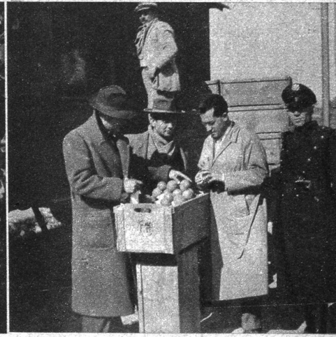
Von links nach rechts: Wo sich das Quellwasser des Aetna mit der fruchtbaren vulkanischen Erde vereint, vergeudet die Natur Kraft und Schönheit in echt südlicher Ueberschwänglichkeit • Das Pflücken der goldenen Früchte erfolgt vom Boden aus in Bogenkörben • «... wo im dunkeln Laub die Goldorangen glühn» • Am Bahnhof werden die fürs Ausland bestimmten Sendungen einer gesundheitspolizeilichen Kontrolle unterzogen. Unten links: In diesen Körben wird abends das Tagewerk mit reich bemalten Zweiräderkarren zum Händler gefahren. Unten rechts: Bereits im Garten werden die Orangen von Blättern und Stielen gereinigt

glühende Masse unaufhaltsam talwärts wälzt, doch, nach Jahrhunderten, wenn die zu Stein erstarrte Lava sich in Erde auflöst, erweist sie sich als mehrmals fruchtbarer denn irgend ein anderer Boden. Die erste Pflanze, die neues Leben in die öde Steinwüste bringt, ist der anspruchslose Kaktusfeigenbaum, der mit seinen kräftigen Wurzeln den porösen Stein zersprengt und so den Boden zum Anpflanzen von Orangenbäumen vorbereitet. Paternò, Produktions- und Handelszentrum der sizilianischen Orangen, liegt heute eingebettet in prächtige, terrassenförmig angelegte Gärten, die bis über 300 Meter über Meer an den Aetna hinaufreichen, um dann durch Olivenhaine, Weinberge und Obstgärten abgelöst zu werden. Diese einzigartig fruchtbare Erde, ausnahmsweise reich an Quellwasser, hat die herrlichsten, süssesten und schmackhaftesten Orangen der Welt hervorgebracht: die Paternò-Blutorangen. Dabei sind zwei Hauptsorten zu un-