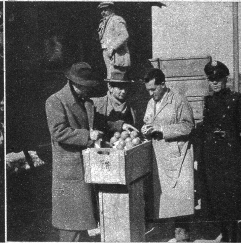
Von links nach rechts: Wo sich das Quellwasser des Aetna mit der fruchtbaren vulkanischen Erde vereint, vergeudet die Natur Kraft und Schönheit in echt südlicher Ueberschwänglichkeit • Das Pflücken der goldenen Früchte erfolgt vom Boden aus in Bogenkörben • «... wo im dunkeln Laub die Goldorangen glühn» • Am Bahnhof werden die fürs Ausland bestimmten Sendungen einer gesundheitspolizeilichen Kontrolle unterzogen. Unten links: In diesen Körben wird abends das Tagewerk mit reich bemalten Zweiräderkarren zum Händler gefahren. Unten rechts: Bereits im Garten werden die Orangen von Blättern und Stielen gereinigt

glühende Masse unaufhaltsam talwärts wälzt, doch, nach Jahrhunderten, wenn die zu Stein erstarrte Lava sich in Erde auflöst, erweist sie sich als mehrmals fruchtbarer denn irgend ein anderer Boden. Die erste Pflanze, die neues Leben in die öde Steinwüste bringt, ist der anspruchslose Kaktusfeigenbaum, der mit seinen kräftigen Wurzeln den porösen Stein zersprengt und so den Boden zum Anpflanzen von Orangenbäumen vorbereitet. Paternò, Produktions- und Handelszentrum der sizilianischen Orangen, liegt heute eingebettet in prächtige, terrassenförmig angelegte Gärten, die bis über 300 Meter über Meer an den Aetna hinaufreichen, um dann durch Olivenhaine, Weinberge und Obstgärten abgelöst zu werden. Diese einzigartig fruchtbare Erde, ausnahmsweise reich an Quellwasser, hat die herrlichsten, süssesten und schmackhaftesten Orangen der Welt hervorgebracht: die Paternò-Blutorangen. Dabei sind zwei Hauptsorten zu un-