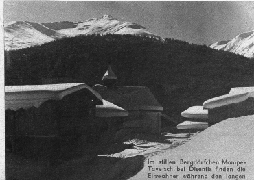
Im stillen Bergdörflein Mompes-Tavetsch bei Disentis finden die Einwohner während den langen