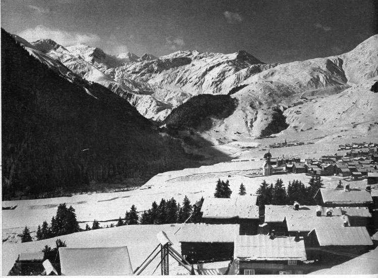
Sedrun mit Blick gegen den Oberalppass

T avetsch — so heisst die oberste Talstufe des Vorderrhodans zwischen der Tödi- und der Tödi- und der Grenzbergen des Nachbarkantons Tessin im Süden. Zwischen Wiesen, Feldern und Wäldern sind locker ein Dutzend Dörfer und Weiler mit wittergebräunten, in den Dämmen des Schnees betäubte versinkenden Heimstätten hingestreut. Berg und Tal ruhen im tiefen winterlichen Schweigen. In schneereichen Wintern reicht der Schnee oft bis zu den Dächern der knisternden Ofen wohl geborgen fühlt.