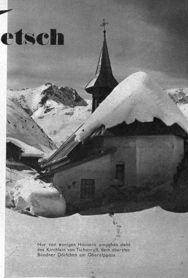
Nur von wenigen Häusern umgeben steht das Kirchlein von Tschamutt, dem obersten Bündner Dörflein am Oberalppass