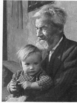
In Grossvaters Schutz fühlt sich der Kleine geborgen

Wer das schöne, stille Tal besucht, wird es nicht bereuen. Er wird sich immer wieder dem stillen, einfachen Völklein hingezogen füh-len und auch dessen Spezialitäten, den Tavetscher Bienehonig, den Ziegenkäse und beson-ders den feinen Schinken zu schätzen wissen.