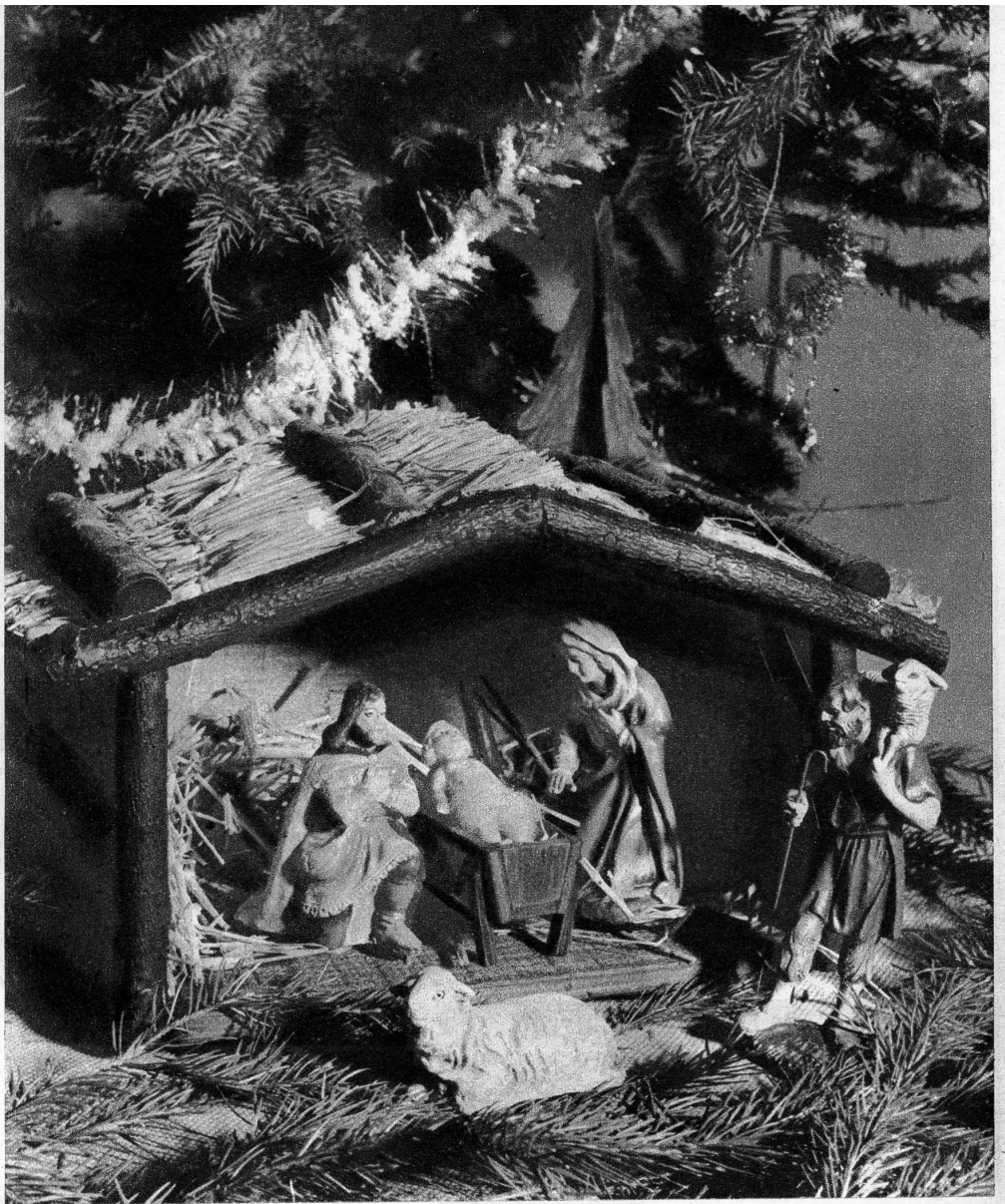
Stille Nacht, heilige Nacht

Die Nacht brach mit der in grossen Höhen gewöhnlichen Schnelligkeit herein. Bald war es ringsherum finster, nur der Schnee fuhr fort, mit seinem bleichen Lichte zu leuchten. Der Schneefall hatte nicht nur aufgehört, sondern der Schleier am Himmel fing auch an,