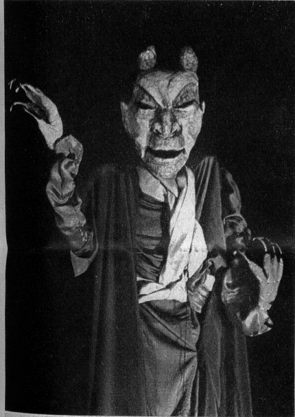
Hier stellt sich Pluto, der Höllenfürst, in seiner ganzen teuflischen Scheusslichkeit vor. Unten: Bevor sich der Vorhang hebt, wird die Platzierung der Puppen und die richtige Stellung der Fäden kontrolliert. Das Spiel mit Holzköpfen begeistert nicht nur das Publikum, sondern zieht auch eine grosse Schar von Helfern aller Altersklassen in seinen Bann