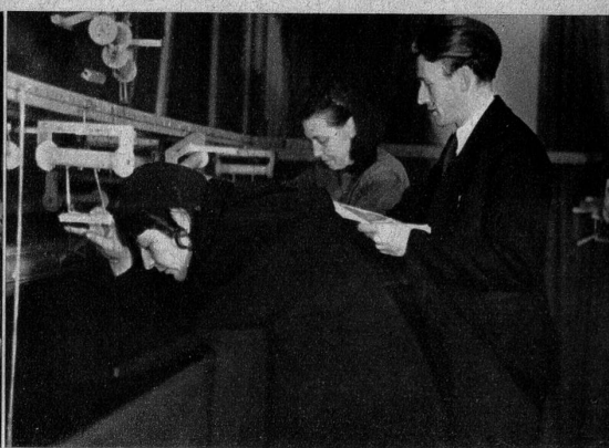
Auch die Musik- und die Geräusch-Installationen müssen auf der meist recht beschränkten Bühne untergebracht werden