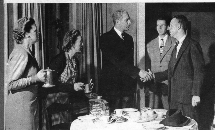
Der Direktor und der Gewerkschaftssekretär finden sich und beschliessen, zusammen das zu tun «was recht ist» und nicht mehr darum zu kämpfen «wer recht hat»