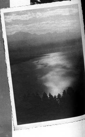
Links: Blick von Caux auf die weite, schimmernde Fläche des Genèverasses