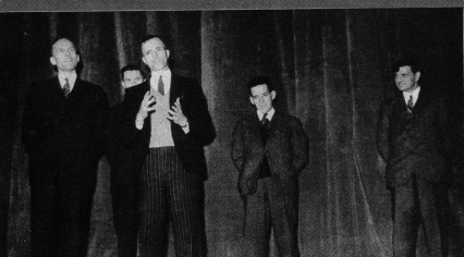
Unter dem Patronat eines schweizerischen Einladungskomitees wurde am Berner Stadttheater von Mitgliedern des Lagers für «Moralische Wiederaufrüstung» das in englischsprachigen Ländern mit grossem Erfolg aufgenommene Industriedrama «The Forgotten Factor» («Der vergessene Faktor») zur Erstaufführung gebracht. Die Aufführung fand vor Parlamentariern, vor Vertretern der Regierung, der Armee und des diplomatischen Corps statt und hinterliess einen nachhaltigen Eindruck. Das Bild: Kohlengrubenarbeiter, Sekretäre der englischen Bergleitetgewerkschaft, legen vor der Aufführung von der Bühne aus Zeugnis ab von der erstaunlichen Wirkung, die die Aufführung dieses Stückes vor ihnen Gewerkschaften in der Schaffung industrieller Zusammenarbeit und in der Beilegung von Arbeitskonflikten erzielte. Unser Bild zeigt (2. von links) den Gewerkschaftssekretär der britischen Kohlengruben, Bill Yates, rechts daneben Jack Ashley und Bill Wilde, beide von North Staffs