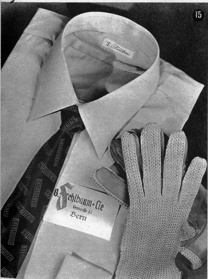
FOTO-KUNST IM DIENST DER WERBUNG