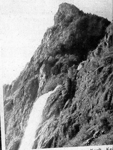
Hier haben wir das Bild ungebändigter Kraft. Kein Wunder, dass es dazu reizte, sie zu bändigen!

gebaut. Am linken Ufer, im Fels eingesprenzt, befindet sich die Anlage, die das Landschaftsbild nicht stört. Jetzt wollte man aber mehr herauswirtschaften, und es ist verständlich, dass männiglich sich für das Landschaftsbild zur Wehr setzte. So haben überall die alarmierten Naturschützer aufgeatmet, als vor einiger Zeit die Nachricht durch die Presse ging, dass die Pisse-Vache auch bei einem Kraftwerkbau in der Gegend unbedingt in ihrer heutigen Gestalt erhalten bleiben soll. Es wird uns also weiterhin vergönnt sein, dem faszinierenden Spiel von Wasser und Licht zuzuschauen, das besonders im Sommer fesselt und zur Zeit der Schneeschmelze.