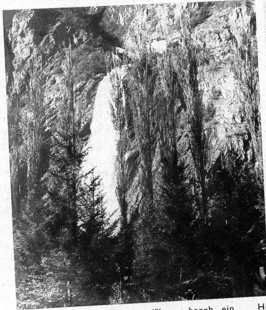
65 Meter hoch stürzt das Wasser herab, ein prachtvoller Anblick