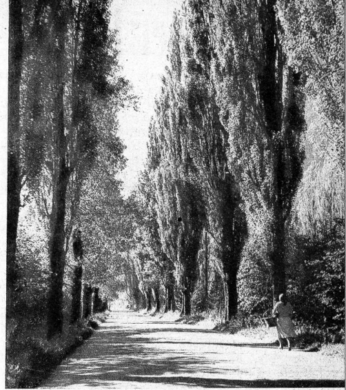
Die Pappelalleen im Wallis ziehen schnurgerade durch das sonnigglühende Rhonetal, aber ganz plötzlich wird der Akzent der Horizontalen durch senkrecht herabstürzende Wassermassen verdrängt und statt trockener Wärme atmet man kühle, feuchtigkeitsdurchsetzte Luft ein: wir stehen am Fuss der Pisse-Vache

Dieses schöne Spiel der Natur sollte nüchternen Erwägungen zum Opfer fallen. Wo die weisse Kohle rar ist, sieht man in jedem Wasserfall einen Turbinenantrieb! Also entstanden Pläne, um die Fallenergie der Pisse-Vache noch besser auszunützen. Vor rund 50 Jahren hat man nämlich schon ein kleines Kraftwerk an der Pisse-Vache