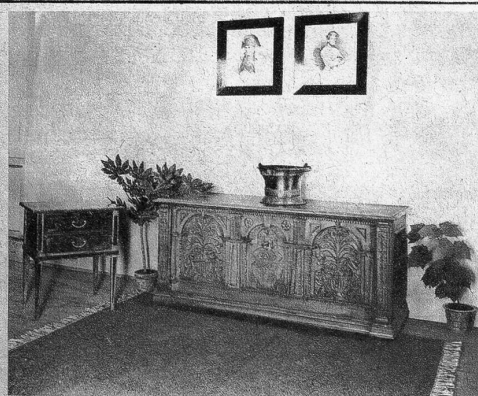
Renaissance-Truhe, Eichenholz, dat. 1617