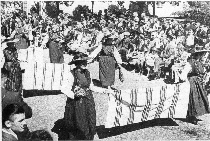
Am Nachmittag bewegte sich ein farbenfroher Festzug durch die fahnen- geschmückten Strassen Langenthals. Das Bild zeigt eine Gruppe Weberinnen aus Oberhasli