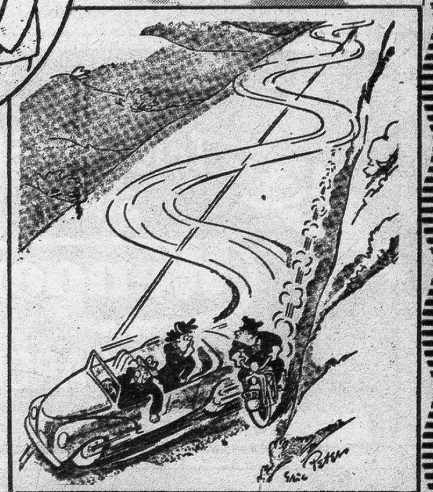
— Pssst, er schläft!