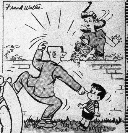
«Ihr Sohn da — nannte mich einen Flachschädel!»