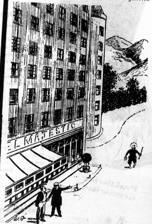
«Das ist der berühmte Hochtourist Oberst Crown, aber er ist heillos wütend, weil unser Lift in Reparatur ist» (Humorist)