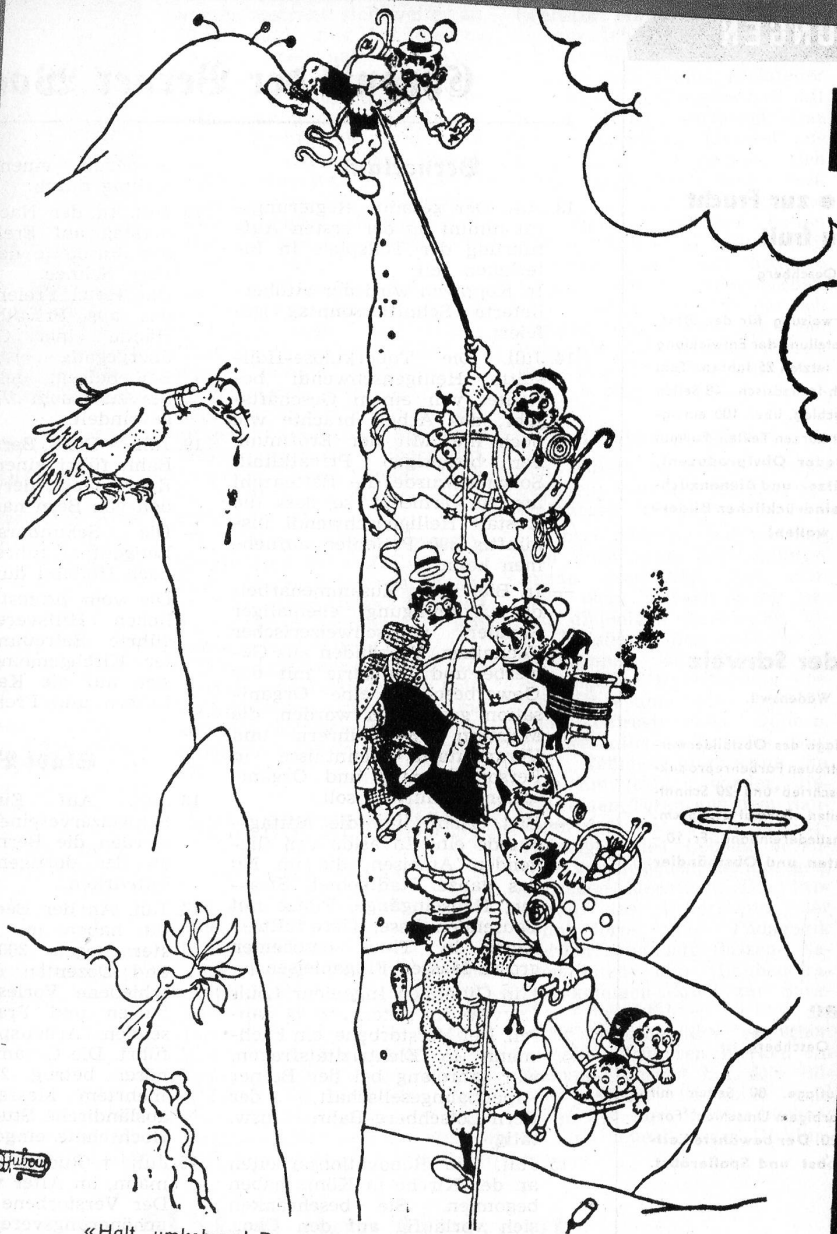
«Halt, umkehren! Das ist nicht der richtige Gipfel!» Ric et Rac