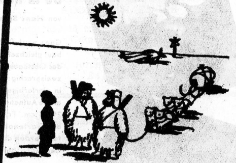
«Er meint, wir hätten uns im Erdteil geirrt!»