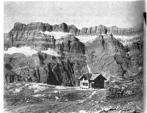
Leglerhütte (SAC) 2277 m inmitten des Glarner Freiberges. Im Hintergrund die Glärnisch-Südseite.

«Es geht nicht gut, wegen der Leute im Büro», erklärte sie ihm. «Ausserdem hätte ich nicht einmal Geld, um mir irgend etwas zu kaufen. Es ist mir auch unangenehm, meinen Schmerz so wie ein Aushängeschild