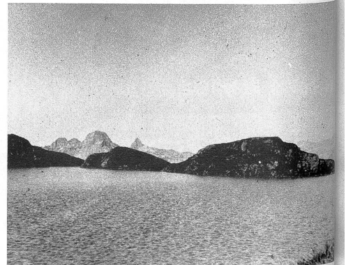
Der Milchspülersee südlich der Leglerhütte. Im Hintergrund (von links nach rechts) Ortstock, Hoher Turm und Faulen.