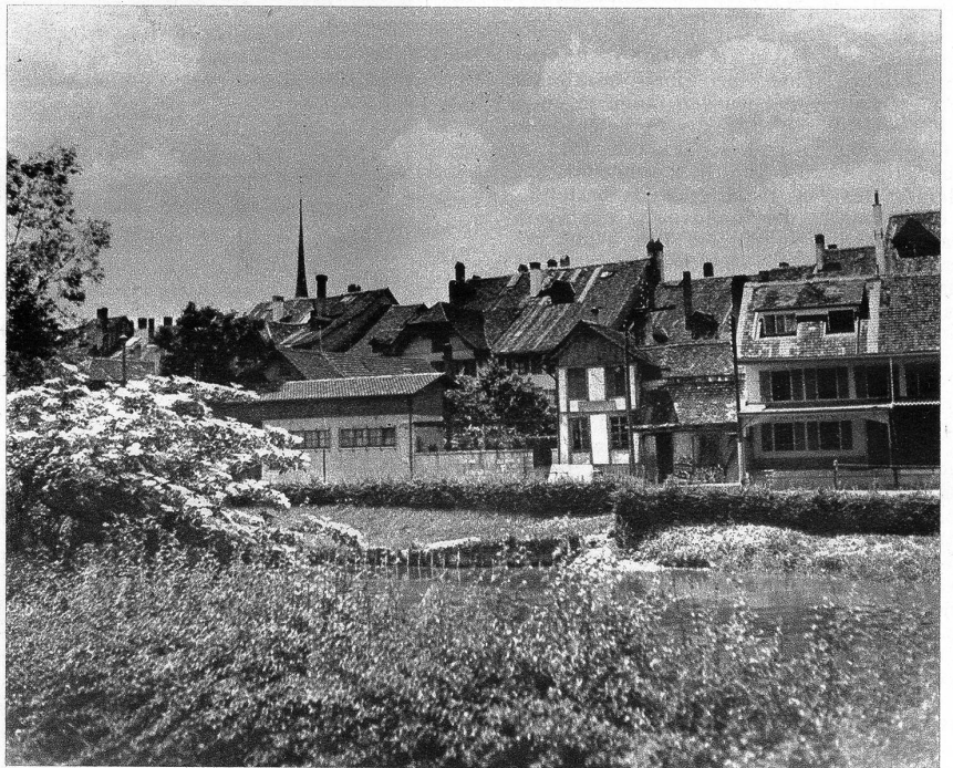
Oben: Blick von der Zihl auf Nidau Unten: Die Umfassungsmauer des Schlosses