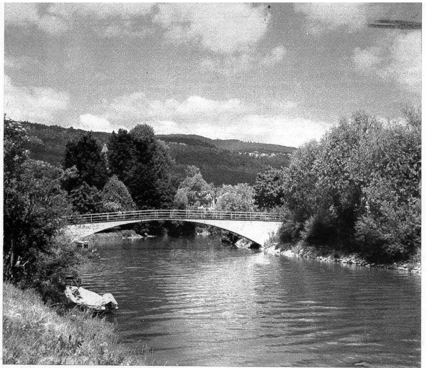
Blick auf die Zihl, die an Nidau vorbeifliesst