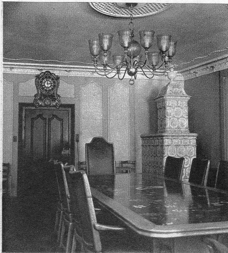
Die Rathausstube dient dem Gemeinde- und dem Burgerrat