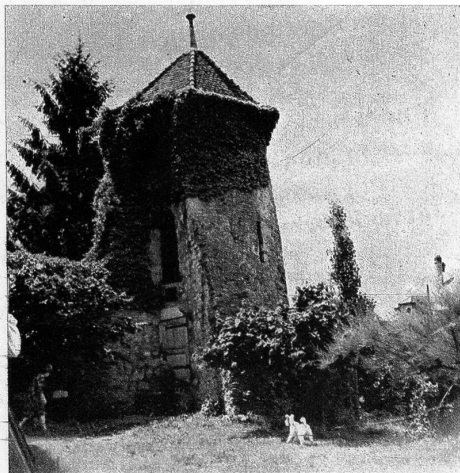
Reste der ursprünglichen Stadtringmauer. Der südwestliche Eckwehrturm

Von alters her kam der «Niedern Aue» am Ausfluss der Zihl aus dem Bieler See eine grosse Bedeutung zu. Stein- und bronzezeitliche Pfahlbauer siedelten sich im «Steinberg» daselbst an, und sie, wie die Kelten und Römer, so ist aus Streufunden zu schliessen, haben den bequemen Wasserweg und seinen Fischreichtum zu schätzen gewusst. Uebrigens hat die Zihl bis in die jüngste Zeit dem Verkehr gedient.