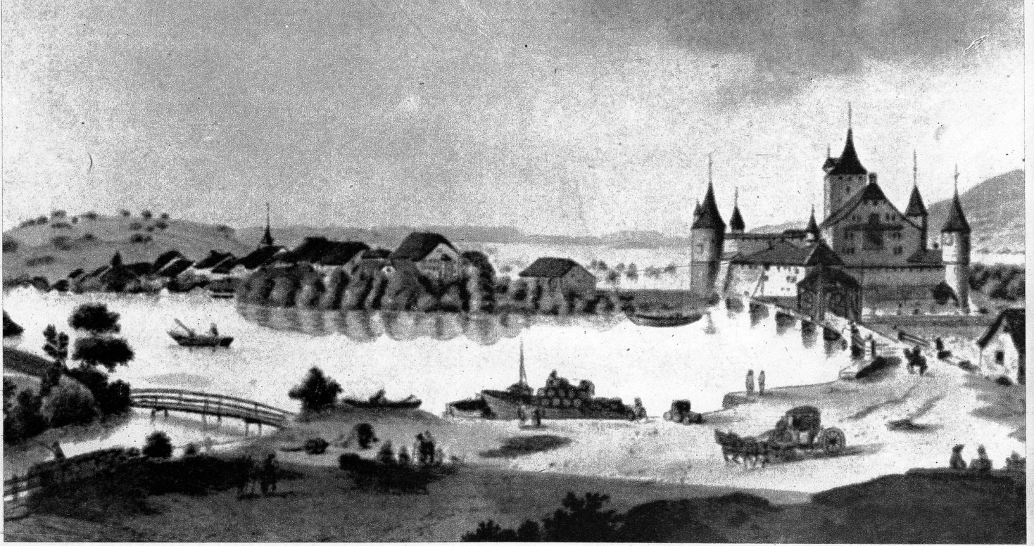
Schloss und Städtchen Nidau, nach einem Stich von Aberly