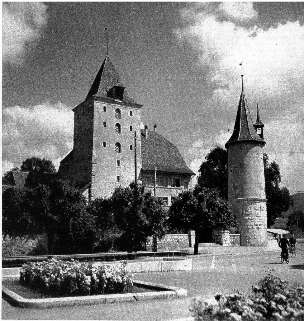
Oben: Das Schloss Nidau in seiner heutigen Gestalt. — Unten: Das Rathaus in Nidau

Die in der Handfeste gewährleisteten Wochen- und Jahrmärkte waren für das Hinterland wie für Biel von grosser Bedeutung, mehr aber noch die Kornmärkte, die Quelle für die Brotversorgung Biels und des nähern Jura. Sah sich Bern zur Sperrung des Kornmarktes veranlasst, so wirkte sich diese Mass-