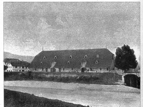
Das Salzhaus, das 1613 erstellt und 1899 abgebrochen wurde

Buchgau. Als Parteigänger Oesterreichs verwickelte er sich in den Konflikt mit Bern und fiel als Anführer der Adligen 1339 bei Laupen.