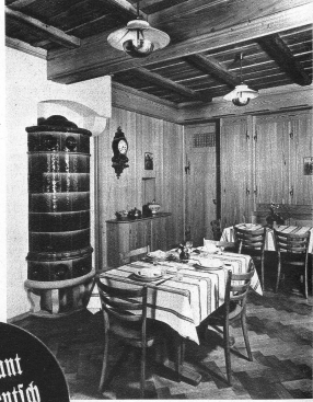
Restaurant Mühledentsch Langnau