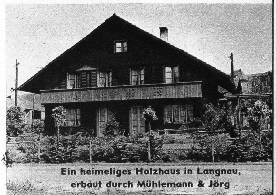
Ein heimeliges Holzhaus in Langnau, erbaut durch Mühlemann & Jörg