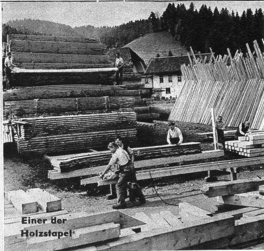
Einer der Holzstapel