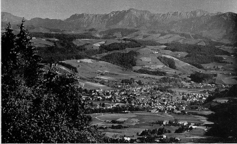
Aussicht von der Moosegg auf Langnau

bauten Speicher, aber auch einfache Hütten und Ställe.