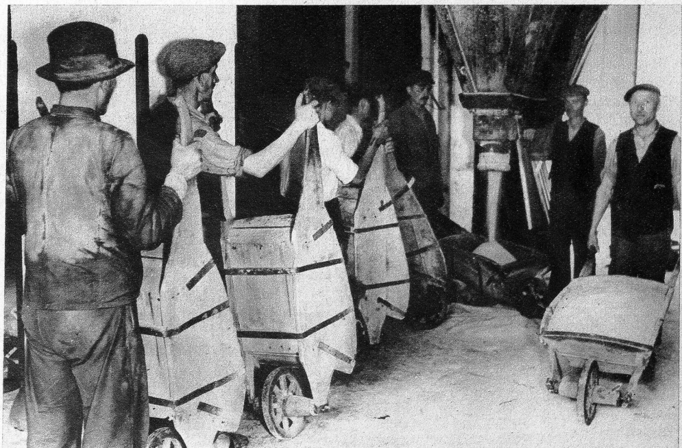
Vermag das Förderband nicht alle Arbeit zu leisten, so wird feingemahltes Steinsalz auch im Schubkarren gefasst und zur Verschiffung gerollt — Links: In der Salzkapelle: Steinsalzfiguren, darstellend die heilige Kunigunde und den heiligen Antonius