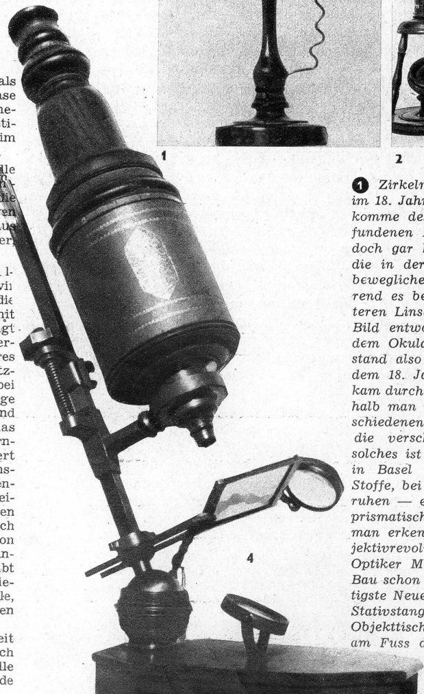
1 Zirkelmikroskop, 18. Jahrhundert. Dieses Mikroskop war im 18. Jahrhundert ausserordentlich verbreitet. Es ist ein Nachkomme des ersten, von Antoni van Leuwenhoeck um 1700 erfundenen Mikroskops. Streng genommen waren dies alles jedoch gar keine Mikroskope, sondern nur Lupen. Denn durch die in der Holzfassung angebrachte Linse wird das (auf der beweglichen Nadel aufgespessete) Objekt direkt betrachtet; während es bekanntlich beim Mikroskop so ist, dass von der unteren Linse — dem Objektiv — im Innern des Mikroskops ein Bild entworfen wird, welches seinerseits der oberen Linse — dem Okular — als Objekt dient. Man betrachtet den Gegenstand also indirekt. 2 Zwei alte Nürnberger Mikroskope aus dem 18. Jahrhundert, aus Holz gedrechselt. Der Dreifusstypus kam durch den englischen Instrumentenbauer Culpeper auf, weshalb man vom Culpeperschen Mikroskop spricht. 3 Die verschiedenen wissenschaftlichen Disziplinen und Praktiken haben die verschiedensten Spezialmikroskope hervorgebracht. Ein solches ist dieses einfache, von der Firma Hoffmann-La Roche in Basel benutzte Mikroskop zur Untersuchung chemischer Stoffe, bei denen — da sie meistens unten in einer Flüssigkeit ruhen — eine Beobachtung von unten gewünscht wird. Durch prismatische Ablenkung ist das bei diesem Instrument möglich; man erkennt gut die nach oben blickenden Objektive am Objektivrevolver. 4 Im Jahre 1708 konstruierte der Londoner Optiker Marshall dieses prachtvolle Mikroskop, das in seinem Bau schon stark an das moderne Mikroskop erinnert. Die wichtigste Neuerung besteht in der Trennung zwischen einer langen Stativstange und dem an ihr befestigten Tubus. Tubus und Objektstisch sind am Stativ verstellbar. Durch ein Kugelgelenk am Fuss des Stativs lässt sich das Mikroskop schräg stellen.