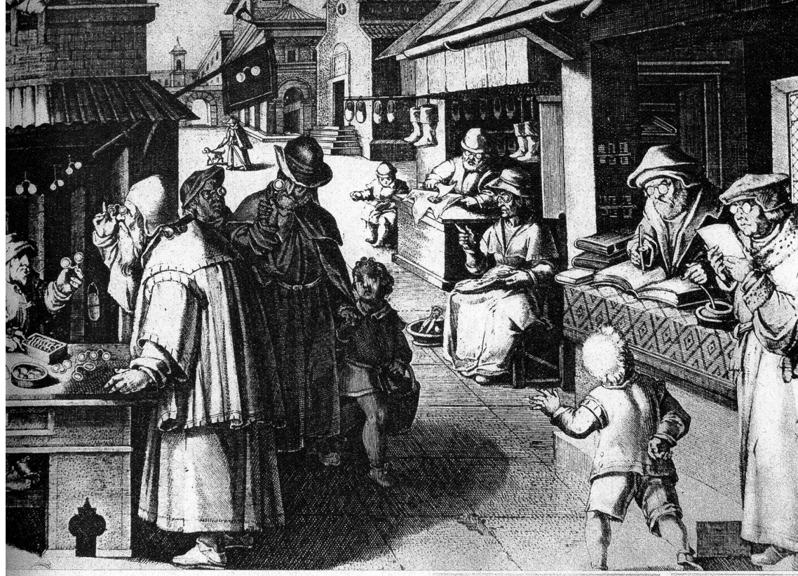
Die Brille, die im 13. Jahrhundert zuerst aufgekommen ist, war in der Renaissancezeit bereits ein weit verbreiteter Artikel. Sie wurde im allgemeinen von herumziehenden Krämern, zusammen mit anderm Kleinkram verkauft. Die erste uns bekannte Darstellung eines ständigen Brillenladens begegnet uns auf einem Stich um 1550 (Joh. Strdanus). Es fällt auf, dass sämtliche Erwachsene, die auf diesem Bilde dargestellt sind, eine Brille tragen.

zur Arbeit freizubekommen. Sie führt Ende des 18. Jahrhunderts zur modernen Ohrbrille, die vielleicht einmal von dem dem Auge angepassten Haftgläsern abgelöst wird. Der eigentliche Erfinder der Haftgläser ist der Zürcher Ophthalmologe Fick gewesen (1888).