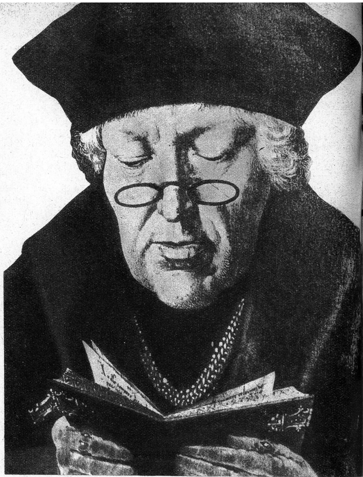
Bügelbrille (aus Horn) mit starrem Steg, auf einem Porträt des Thomas Morus aus der Werkstatt Hans Holbeins d. J., Anfang 16. Jahrhundert. Während die Nietbrille noch aus zwei auseinandergeklippten Stielgläsern besteht, sind bei der Bügelbrille die beiden Teile bereits durch einen festen Steg miteinander verbunden.