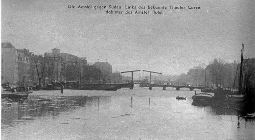
Die Amstel gegen Süden. Links das bekannte Theater Carré, dahinter das Amstel Hotel