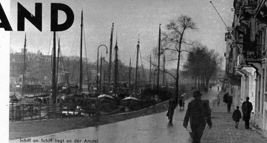
Schiff an Schiff liegt an der Amstel

Holland, das im allgemeinen nur bis 12 Meter über Meer und von dem grosse Teile unter dem Meeresspiegel liegen, hat ein dementsprechendes Klima, und ich bekam schon in den ersten Stunden einen Versuch von holländischen Nebel, der sich blitzschnell über das ganze Land zog. Nur gut, dass die Autobahn von Rotterdam nach Amsterdam ein Bahn auf zwei Bahnen ohne Gegenverkehr gestattet, denn bei diesem Nebel, der eine Sicht von kaum 10 Metern erlaubte, war das Spritzen keine reine Freude mehr. Feiner Niesel regnete auf den Brücken, die über die Kanäle führen, kommen diese schönen Strassen zusammen - eine gefährliche Angelegenheit, die jeden Tag Unglücke herbeiführt. In Reich und Glied präsentiert sich Am-