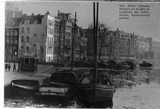
Von diesen schmalen Häusern aus wurden die Geschichte des holländischen Aussenhandels gebau

sterdam, die Häuser in Uniform und oftmals so Spielzeug extornernd und tatsächlich kann man Frauen sehen, die die Hausfassaden mit Schrupper und Wasser bearbeiten, von den Trottoirs nicht zu sprechen. Ein Drehorgelmann dudelt trotz der Dunkelheit noch immer umher und seine Orgel ist so gross wie zwei alte Zürcher-Weltenschänke auf Rädern.