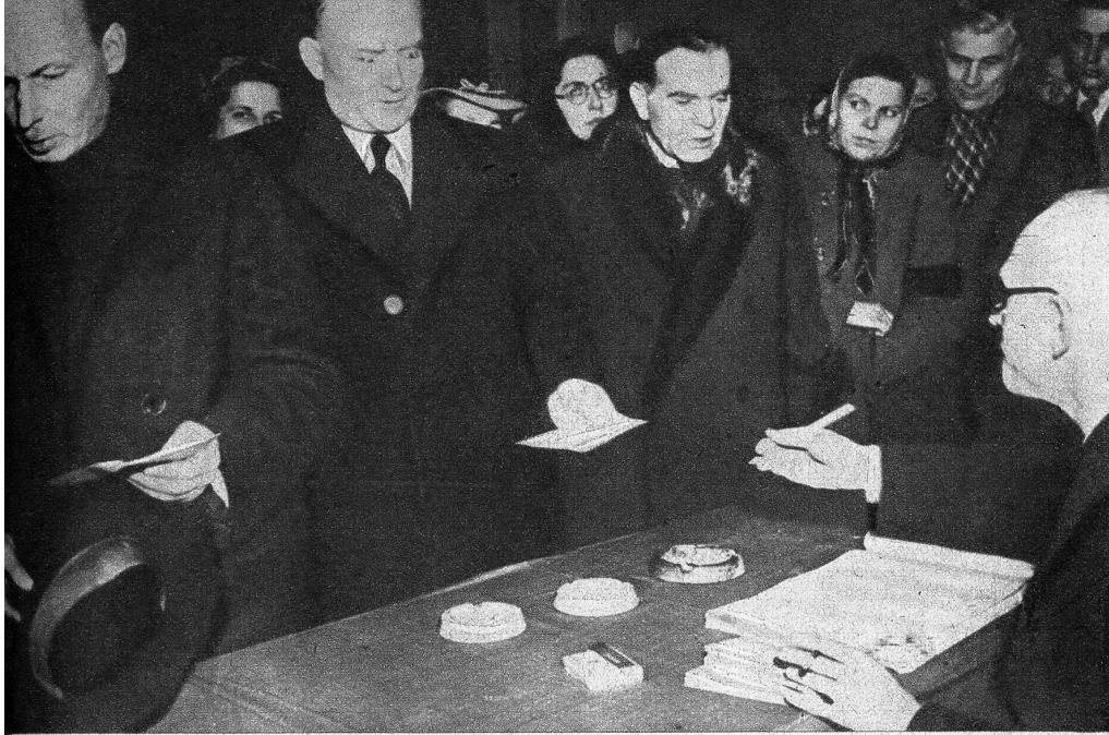
In Polen sind die Wurfel gefallen, und zwar erwartungsgemass nach links, nachdem die Wahlermassen vom «Demokratischen Block» unter einem massiven Druck gehalten worden waren. — Es wirkt denn tatsachlich auch etwas sonderbar, dass in einem Lande, wo die Bauern die Mehrheit der Wahler stellen, die Bauernpartei von einer kommunistisch-sozialistischen Koalition in einem Verhaltnis von 15 : 1 geschlagen worden sein soll... — Unser Bild zeigt den Fuhrer der Bauernpartei, Stanislaus Mikolajczyk, bei der Entgegennahme des Stimmkouverts in einem Warschauer Wahllokal, nachdem er 2½ Stunden in der Wahlerschlange ausgeharrt hatte (weiter von links) ATP

tarbundnis, welches dauernden Charakter haben und Frankreich jede Sicherheit verschaffen soll. Es gilt, einem Volke die Furcht auszureden, die es vor allem, was «deutsch» heisst, nun einmal empfindet.