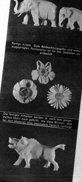
Farlige Arbeit. Gute Beobachtungsgabe und einen ausgeprägten Formensinn ist für das Gestalten unerlässlich