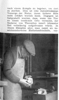
Der Künstler hält zwei Spitzenreste von Elfenfantenzähnen in der Hand, von welchem Material er Blumen und Tiere schnitzt. Mit dem kostbaren und auch seltenen Material muss sparsam umgegangen werden, kostet doch das Kilo Elfenbein heute ca. 100 Franken