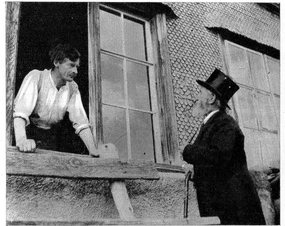
Hier teilt er einem Verwandten des Toten das Ableben mit. «Die Verwandte lönd i ersueche mit dr Frau z'Chelche z'cho am Mettwochvormittag am dri vor em Hus...»