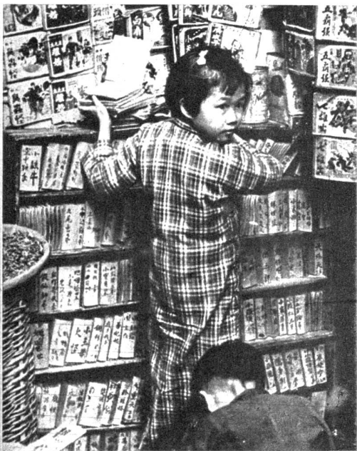
Mit allen Mitteln werden die elementarsten Kenntnisse im Lesen und Schreiben gefördert: Selbst für Kinder gibt es Leihbibliotheken mit Walt Disneys Micky Mouse-Büchern und Schneewittchen, die in China genau so populär sind wie in Amerika oder Europa. Die Mietgebühr für eines dieser Bücher beträgt umgerechnet zirka 1 Rappen