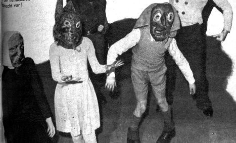
Ich kommt sich fast wie hier heimischen macht vor!

Er war so müde, aber er wusste, dass er jetzt noch weniger würde schlafen können als zuvor.