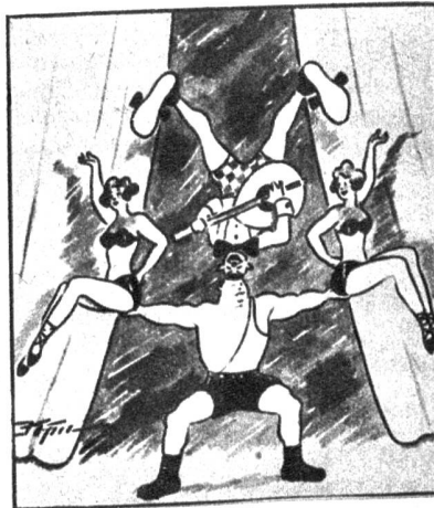
«Auf deiner Seite sind 2 Pfund zu viel, Mizzi; wenn du noch einmal Kalbshaxe vor der Vorstellung isst, dann gib't was!»