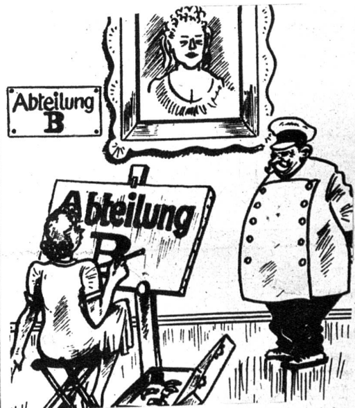
«Wissen Sie, Herr Aufseher, ich muß doch als Anfängerin erst leichte Sachen kopieren!»