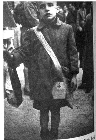
Ein jugoslawischer präüberkulöser Bub bei seiner Ankunft. Jedes Kind war mit einem Kaput, einer Lunchtasche, einem Pyjama, einer Zahnbürste und Zahnpasta ausgerüstet, alles ein Geschenk der Amerikaner (UNRRA)