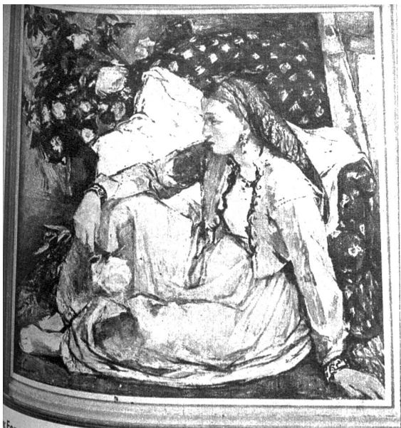
«Femme Orientale». Oelgemälde von Nanette Genoud, Lausanne