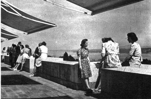
In der kurzen Mittagspause erfreut sich die schöne Terrasse beim 8. Stockwerk besonderer Beliebtheit. Sie, die grösstenteils zum erstenmal in der Schweiz sind, können sich an den landschaftlichen Reizen kaum sattsehen.