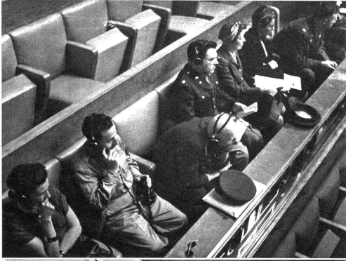
Neben den verschiedenen Delegationen von 38 Ländern sind noch zahlreiche Beobachter und Abgeordnete zugegen, die interessiert den Reden folgen. Der russische Offizier (in der Mitte) scheint über die Worte La Guardias etwas nachdenklich gestimmt zu sein.