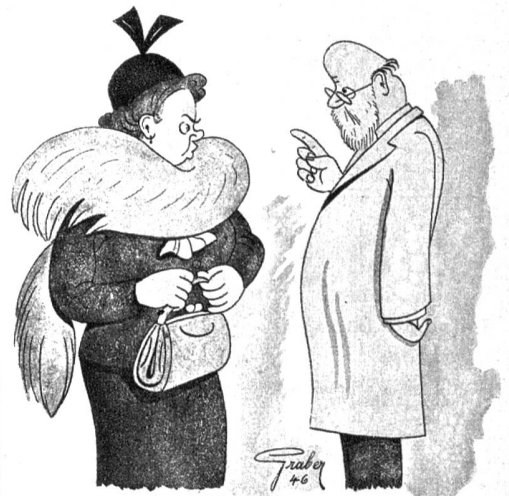
Beim Arzt. «Das Geheimnis eines langen Lebens ist Zwiebelessen.» — «Und, Herr Doktor, wie kann man das Geheimnis bewahren?»

Senkrecht: 1. Abkürzung für westeuropäisch, 2. Schwanzlurch, 3. Stadt in der Provinz Düsseldorf, 4. weibliche Verwandte, 5. Auerochs (Mehrzahl), 6. künstliches Wasserreservoir (Mehrzahl), 8. leichtes Windwehen, fächeln, 9. siehe Anmerkung, 11. Schnelligkeitswettbewerb, 12. siehe Anmerkung, 14. Strassenbelag, 16. Augenkrankheit, 20. fehlgehen, 24. einer der Hauptangeklagten in Nürnberg, 26. Nibelungengestalt, 27. Sache (lat.)