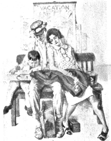
Ausgeruht kommen wir aus den Ferien zurück.