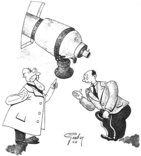
«Das Licht jenes Sternes, den ich eingestellt habe, braucht mehr als zwanzig Jahre, um die Erde zu erreichen» — «Dann geh' ich; so lange kann ich nicht warten!»