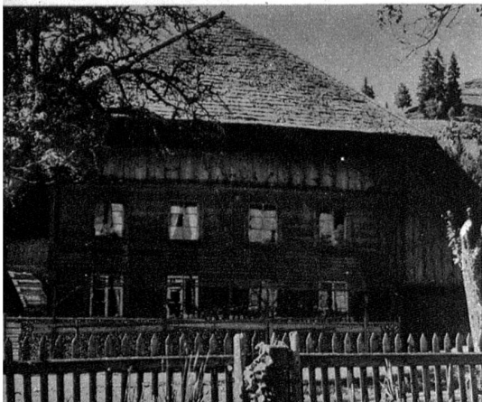
Links: Die Ostseite des im Heimatstil gehaltenen Heimes