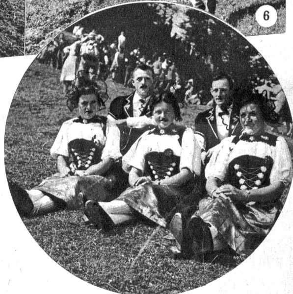
Geschwister einer bodenständigen Bergbauernfamilie am Fest der Aelpler