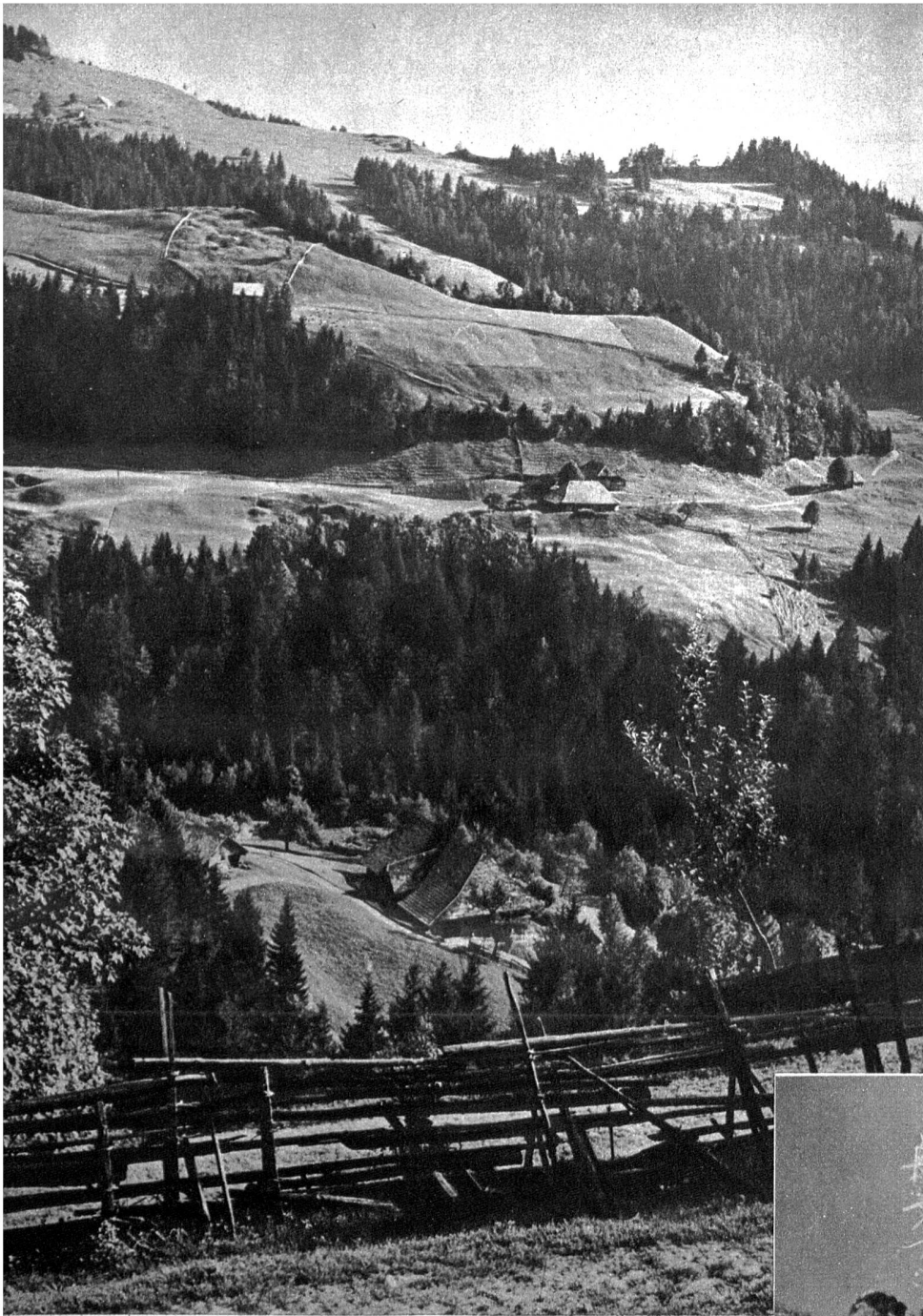
Blick auf das im Vordergrund liegende Bergheimetli Blütenriedli. Jenseits des Tannenwaldes grüssen der untere und obere Lohngrat. Auf höchstem Punkt die zum Truber Boden gehörende Schinenalp