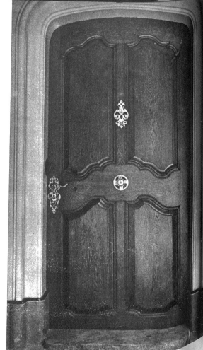
Vorstülpige Barocktüre des Hauses Kesslergasse 2, an der fehlende Türklopfer sollte ersetzt werden

«Recht so, guter Freund!» ruft der Graf schmunzelnd aus. «Das glaube ich gern, dass du diesen Thron nicht gegen meinen eintauschst...!»