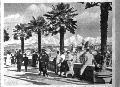
Däm hie seil me o Fotomontage. Dert, wo d'Pünkli sy, het me d'Bärge zwärs ine gsetzt. Drum dorlet dir nid enttächt sy, we dir de uf eune Foto albe nid eso viel druffe het. Die Charte sy äben albe nid richtig