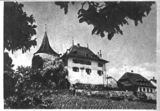
Lueget immer, we möglich links oder rächts vom Bild es Bäuml oder es Zweigli druf z'übercho. Ds Bild wird de viel läßiger, oder fotografisch gseil, plastischer