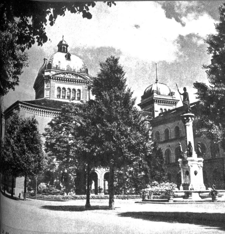
U dem Bild het mer die wunderbari Würkig vom Gälbfiler. Ohni die Wulke ohni die Baum links und rächts wärd das Bild langwillig