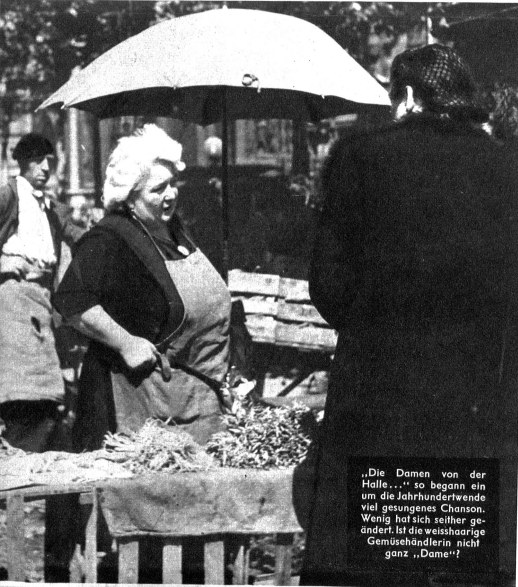
„Die Damen von der Halle...“ so begann ein um die Jahrhundertwende viel gesungenes Chanson. Wenig hat sich seitler geändert. Ist die weisshaarige Gemüsehändlerin nicht ganz „Dame“?

Unglaublich gross sind die Mengen an Nahrungsmitteln, welche durch die Hallen den Weg in die Pariser Küchen finden: 200 000 000 kg Fleisch, 50 000 000 kg Obst und Gemüse, 60 000 000 kg Fische, 30 000 000 kg Geflügel jährlich