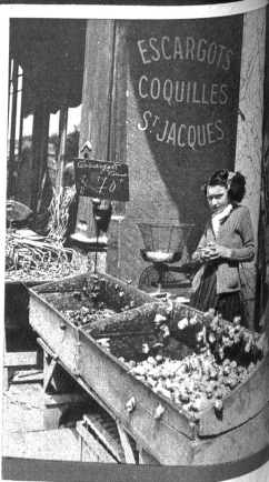
„Lebende Schnecken — 70 Francs das Kilo.“ Die Kleine muss aufpassen, dass die Ware nicht verwirrt, während die Mutter die Kunden bedient.