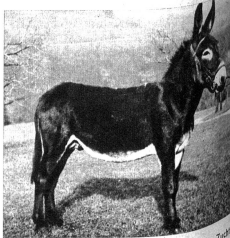
Der Eselhengst Bono aus der königlichen Zucht von Marlino-Franca

Das Maultier ist ein eigenartiger Bastard, den man muss sich fragen, weshalb es seit Jahrhunderten gezüchtet wurde. Der Laie versteht noch sehr oft seinen Namen und dem Maultier Maulesel und dem Maultier Eselhengst. Unser Maultier ist ein Kreuzprodukt von Pferdestute und Eselhengst, während der Maulesel aus der Eselin und dem Eselhengst hervorgeht. In der Schweiz hat die Bedeutung erreicht, wohl weil er auch in unsere südlichen Bergkantone zu klein und eigenmächtigerweise sind Maultiere und Esel nicht weiter fortpflanzungsfähig. Den Eseln, weil das Zuchtprodukt seltene Eigenschaften hat. Das Maultier ist einmal anspruchslos. Es ist in der Fütterung ausserordentlich anspruchslos. Auf Körnerfuttermittel es und leistet trotzdem schwere Arbeit. Das Tier ist überaus zäh und langweilend und sich erst hinlege, um zu sterben. Man sagt von ihm, dass es nie krank wird und mit ihm mit 60 Lebensjahren, wo die robuste Arbeitskraft und die stele Arbeit anhalten. Als sicherer Träger grossen Lasten ist das Maultier unübertroffen. Es ist schmäler, überaus zäher Huf findet auf weichen Bergpfaden den sicheren Weg, und weiches nicht, das Maultiere je über Eiseleisenschienen, was dagegen bei Pferden noch nicht oft vorkommt. Auch als Reittier ist es geschätzt und zeigt eine Anmut, die man bei schweren Zug nie zugetraut hätte. Alle diese verschiedenen Verwendungsmöglichkeiten werden das alte Ansehen, das dieses Tier