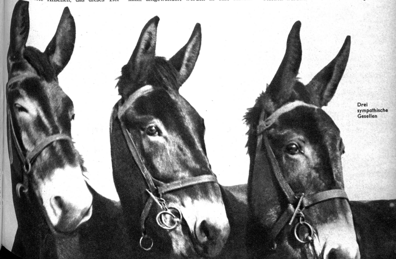
Drei sympathische Gesellen