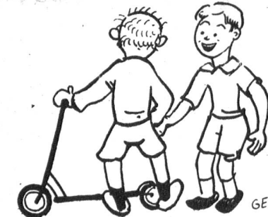
«War dein Husten auch so schlimm?» «Mensch! Viel schlimmer. Bei mir war er in den Ferien»