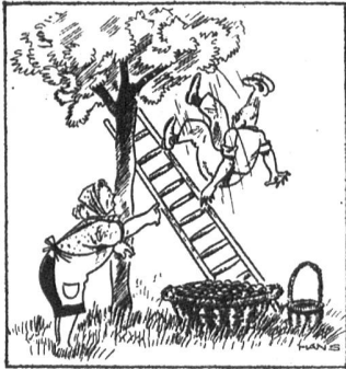
«Egon, pass auf, die Pflaumen stehen hier»