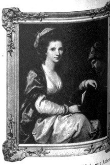
Angelica Kaufmann: Selbstbildnis mit Altar-Büste

Es ist klar, dass eine solch mächtige Anordnung von seltenen Kunstschätzen nur mit Hilfe der zahlreichen Leihgeber der Kirchen, Museen, Klöster und Privaten ermöglicht wurde, was auch die Vertreter der Regierungen Berns und Graubündens beim Festakt des Bändervereins Bern im Hotel Schweizerhof deutlich zum Ausdruck brachten und dafür den Dank der Behörden aussprachen. Beim gleichen Anlasse begrüßte Verkehrsdirktor Buchli, als Präsident und Initiator der Veranstaltung, die Behörden und Gäste. Musikvorträge des Bündner Männerchors, der Canzan Ladina und Herwig Nussos verschönten das Fest und gaben ihm den richtigen stimmungsvollen Inhalt. So ist uns «La Griglia» in ihren Werken der Kunst und Literatur und in ihren fröhlichen und guten Menschen ganz nahe ans Herz gekommen, und wir werden die Sympathie zu diesen Menschen und zu diesem Lande nun auch weiter pflegen und hüten. Es scheint, dass auch die «Bernischen Kunstschätze» in mehreren Jahrhunderten den Weg nach Graubünden finden werden, um die Beziehungen weiter zu vertiefen.