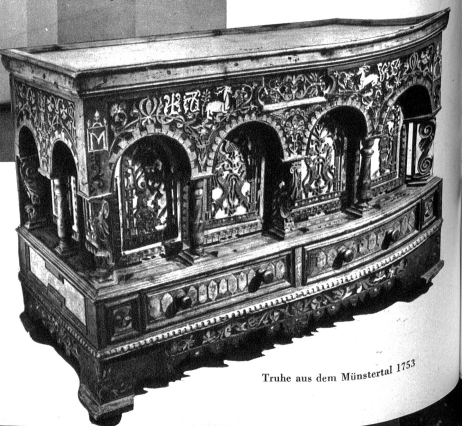
Truhe aus dem Münstertal 1753

erfüllt den Besucher mit Andacht und Bewunderung. Man fragt sich unwillkürlich, aus welcher Quelle die Kräfte stammen, die den Figuren des Mittelalters das Leben ins Holz geschnitten haben. Wichtig und zugleich zart, gross und zugleich klein und niedlich, voll menschlichen Empfindens und doch zugleich wesenlos, wie die Materie, aus der sie gebildet sind, treten sie uns entgegen und sprechen stumm eine Sprache des Leidens, der Gebete, der Liebe und des Kampfes um die Freiheit des Menschen. Die ganze Komposition, wie sie unter den Händen von Prof. Dr. Hugger entstanden ist, bedeutet Kunst, eine wirkliche tiefe Kunst eines ganzen Volkes.