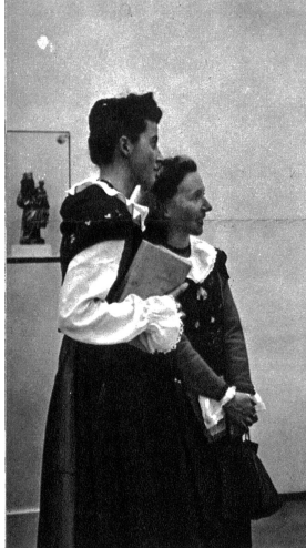
Zwei Welten begegnen sich. Junge Bündnerinnen betrachten die Reliquienbüste des heiligen Placidus aus dem 15. Jahrhundert