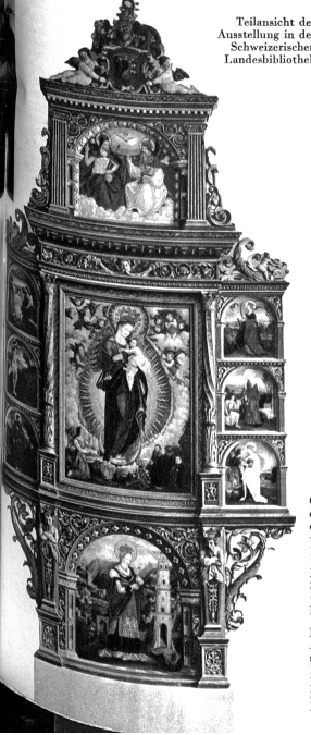
Teilansicht der Ausstellung in der Schweizerischen Landesbibliothek