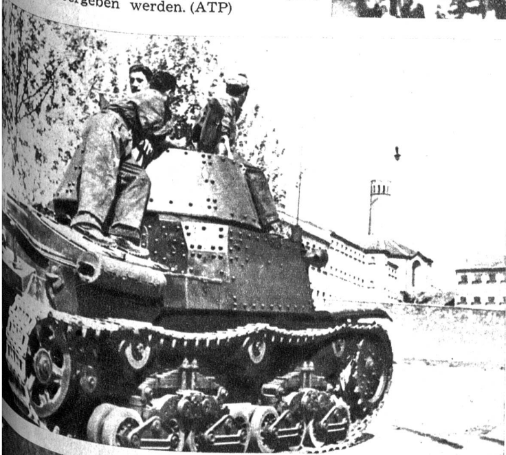
Links: Den revoltierenden politischen Gefangenen im San Vittore-Gefängnis in Mailand, die eine Anzahl von Geiseln in ihre Gewalt brachten, vermochte die Polizei allein nicht beizukommen, wie wohl sie, wie man sieht, mit Tanks aufrückten. Nach harten Kämpfen haben sich die Gefangenen jetzt ergeben.