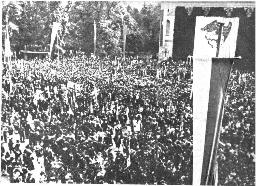
Rechts: Oesterreich ruft Südtirol! In einer mächtigen Kundgebung, aus allen Landesteilen Oesterreichs, vor allem aus den Tiroler Tälern besucht, wurde in Innsbruck die Rückgliederung von Südtirol an Oesterreich gefordert. Bundeskanzler Figl konnten 155 000 Unterschriften von Südtirolern zugunsten der Vereinigung übergeben.