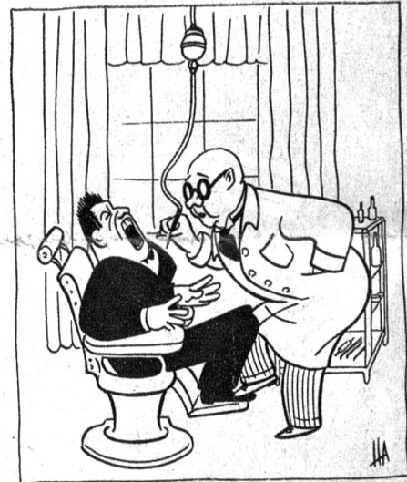
„Was schreien Sie denn so, ich habe Ihren Zahn ja noch gar nicht berührt.“ — „Aber Sie stehen doch auf meinen Hühneraugen.“