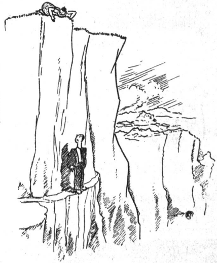
„Leb wohl, Erna, ich muss niessen.“