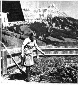
Der Garten wird umgegraben und gemistet im Hintergrund der Schybegütsch