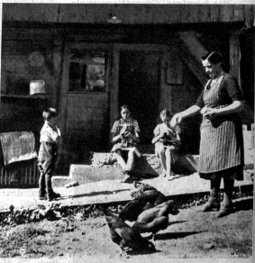
Ländliches Idyll. Während die Mutter die Hühner füttert, sieht man die beiden Töchterchen im Hintergrund, die eine beim Strümpfe flicken, die andere beim Strümpfe stricken