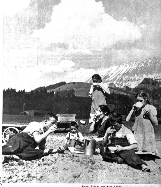
Beim Zvieri auf dem Felde.