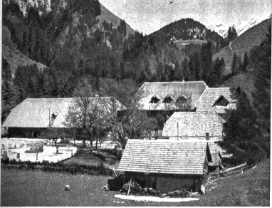
Das Kemmeriboden-Bad ist ein bekannter Kurort tief im Emmental am Fusse des Hohgant