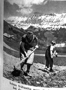
Schon frühzeitig muss die Jugend bei der Feldarbeit mithelfen