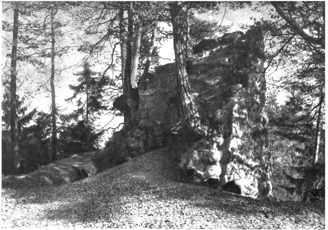
Die heutigen Ruinen der Ritterburg Geristein oberhalb Bolligen

von der einstigen Burg den Namen erhalten hat und heute einen Schulbezirk der ausgedehnten Gemeinde Bolligen bildet. Von Bolligen aus erreicht man das romantische, abgegrenzte Dörflein auf einem prächtigen Wanderweg, der die Landstrasse meidet und über den einseitig gelegenen Bauernweiler Flugbrunnen zur Hochterrasse des Dörfchens Bantigen emporsteigt. Auf dem alten Römerweg durchs Bantigentälchen, das zwischen den waldbedeckten Höhen der Stockeren und des Bantigers verlassen liegt, erreicht man den romantischen Hügel von Geristein. Unterwegs streift man das kleine versteckte Tälchen bei Harnischhut. Im Kriege mit der Stadt Bern sammelte der Graf von Kyburg 1333 im Aargau viel Kriegsvolk und unternahm einen Zug gegen Bern. Aehnlich wie es früher König Rudolf bei der Schosshalde getan hatte, wollte er die Berner aus ihrer festen Stadt herauslocken, um sie ausserhalb ihrer Mauern zu schlagen. In einem Hinterhalt bei Geristein versteckte er den grössten Haufen seiner Leute und liess nur wenige gegen die Stadt reiten. Er dachte, die Berner würden in