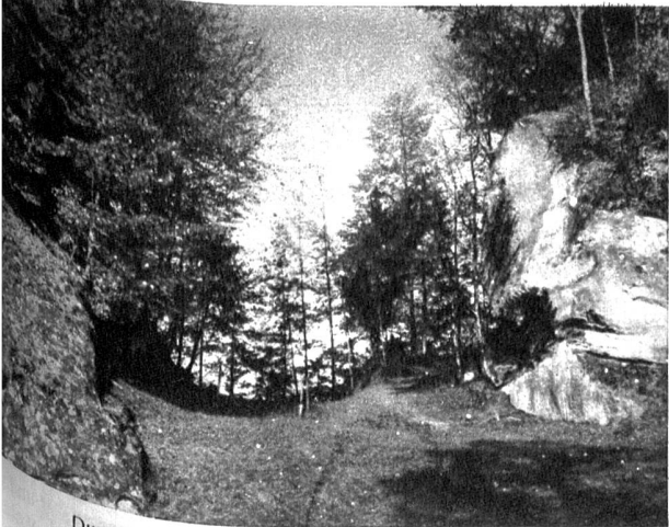
Durchgang der alten Römerstrasse bei Geristein

Unordnung ausziehen und den wenigen Reitern nachjagen, und dann wollte er sie aus dem Hinterhalt überfallen. Die Berner erinnerten sich aber noch gut an das Gefecht bei der Schosshalde, zogen mit ganzer Macht und wohlbedacht aus und verfolgten die Feinde. Als der Graf das sah, wusste er wohl, dass er nichts ausrichten konnte. Er brach auf und floh gegen Burgdorf. Die Berner aber griffen den Haufen im Hinterhalt bei Geristein an, schlugen ihn mit ganzer Macht und nahmen mehrere vornehme Feinde gefangen. Der Ort, wo der feindliche Hinterhalt, die geharnischten Ritter lagen, heisst noch heute «Harnischhut».