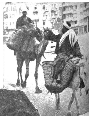
Strassenbild in Kairo