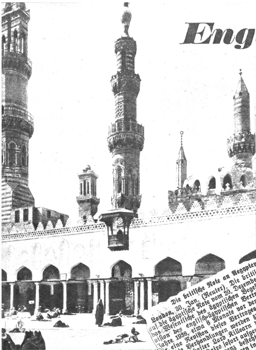
Die El-Asbar-Moschee in Kairo