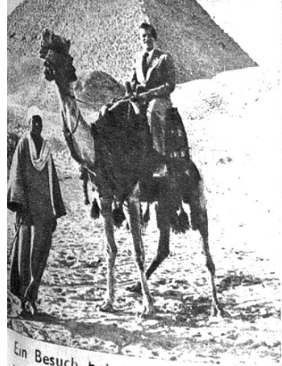
Ein Besuch bei den Pyramiden von Gizeh bedeutet für alle Fremden ein Ereignis