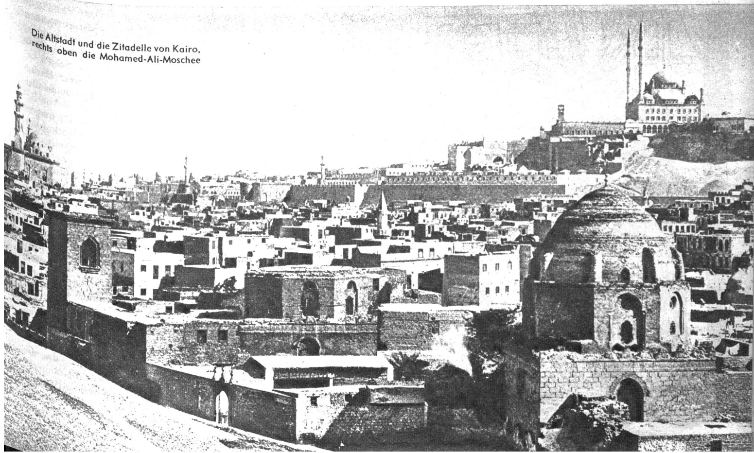
Die Altstadt und die Zitadelle von Kairo, rechts oben die Mohamed-Ali-Moschee