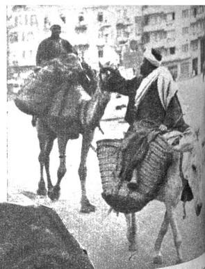
Strassenbild in Kairo