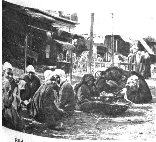
Bild aus den Nebenstrassen der Hauptstadt