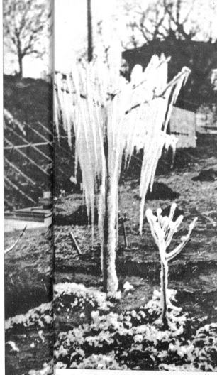
Bäume während der Vereisung aus

das Wasser ab. Die Bäume, stundenlang unter Eis gelagert viel besser, als die andern, die nicht geliehen bei eben erfroren. Hexerei? Keineswegs, sondern nur die Anwendung des physikalischen Gesetzes, denn nur durch von gefrierendem Wasser sich dauernd um Null Grad zu bewegen. Mit dem Uebergang des Wassers vom flüssigen in den festen Zustand wird eine grosse Wärmemenge in Form des Temperaturschwundes unter Null frei, die zum Teil dem Grund müssen die Bäume dauernd unter Null Grad liegen. Sie haben dann keine tiefere Temperatur zu ertragen, unbekümmert darum, ob das Thermometer zeigt, dass die Pflanzen, die 0 Grad ertragen, sind vor Frost geschützt. Solange sie in der schützenden Eisschicht vor Frost liegen Prof. Cattien, die in weitem Umkreis Beachtung