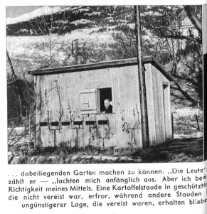
... dabeiliegenden Garten machen zu können. ...Die Leute zählt er —, «lachten mich anfänglich aus. Aber ich bewies die Richtigkeit meines Mittels. Eine Kartoffelstube in geschützter Lage, die nicht vereist war, erfor, während andere Stauden in ungünstiger Lage, die vereist waren, erhalten blieben