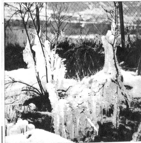
Die Eisbildung an den Bäumen ist eine Notwendigkeit, zumal man durch sie die 80 Kalorien Wärme (pro Kilo Eis) oder, wie der Physiker sagt, die sogenannte latente Schmelzwärme erreicht