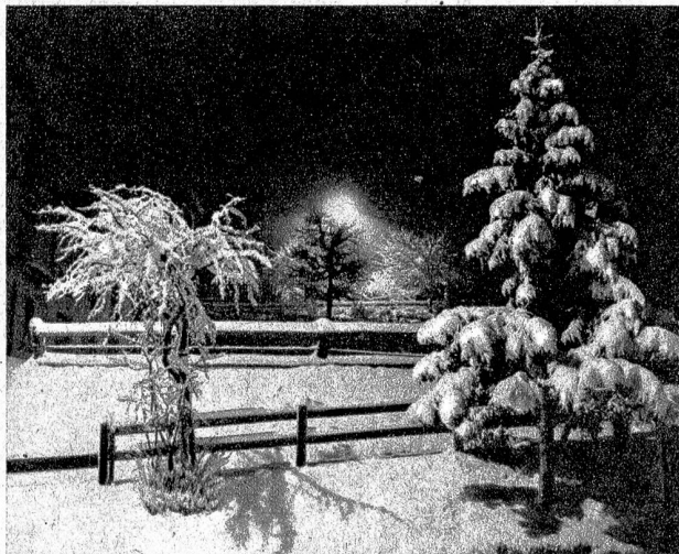
Durchs verschneite Dorf schreitet die Nacht

„Beruhigen Sie sich, Madame“, sagt er mit aufrichtiger Wärme, „dieser Irrtum wird sich ja aufklären lassen. Viel-